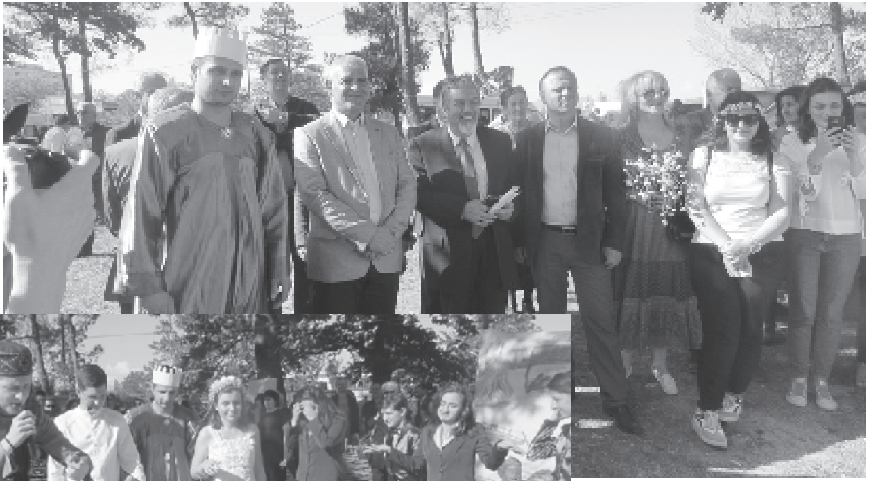
საერთოდ ტყეებისა რა მოგახსენით, მა-გრამ მუხრანის ტყეში სამტრედიელებ-მა ისეთი ამბავი დაატრიალეს, გუბერ-ნატორის აპლუაში მოსულმა დლაქი-

“სავარდო და სამაისო” მზისთვის მომღერალი გვირილების თეორ ქათი-ბში – ათასცხრასისანი წლების ადღე-ენილი ტრადიცია, “გიმნაზისტების” ქე-ელმოქმედებიდან 21-ე საუკუნის ქუთა-ისობამდ რეგიონის მთავარ სახალხო