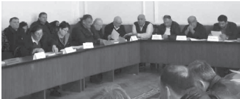
რდაბირი განკარგვის წესით, აღნაგობის ფორმით, პირობით სარგებლობაში გადაცემაზე მერისთვის თანხმობის მიცემის საკითხში. “მოვიწვიოთ საკრებულოს სხ-