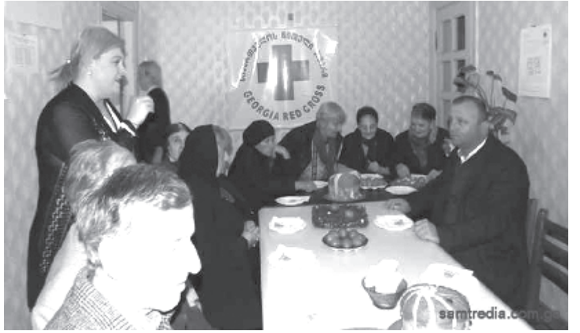
ლი მოსახლეობისთვის “მეგობრობის ოთახის” მოწყობა.” სააღდგომო ამანათი, რომელშიც

ით არაერთი კარგი ღონისძიება დაფინანსებულა წითელი ჯვრის სამტრედიის ფილიალში. ადგილობრივი მერიის დახმარებით გამოგვეყო ფართი, რაც მოხუცებისა და არა მხოლოდ მათთვის, მეტი კომფორტის შექმნის შესაძლებლობას მოგვცემს. “სოქენის” პროექტის დახმარებით ფართის გარკვეული ნაწილი გარემონტდება. დანარჩენის შესარემონტებლად სპონსორს მოვიძიებთ. დახმარებას ადგილობრივი სახსრებითაც გავვიწვევს ადგილობრივი მერია. კიდევ ერთხელ მადლობა მათ ამისთვის. ამ პროექტის მიზანია სოციალურად დაუცველი, მრავალშვილიანი და ღვენი-