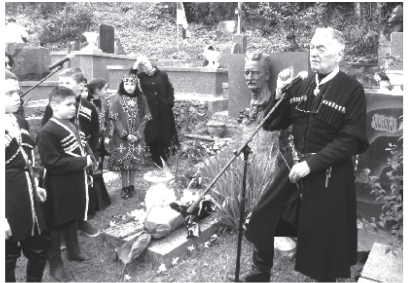
14 მარტი ქუთაისში მოსწავლეებისთვის ინტელექტუალურად დატვირთული