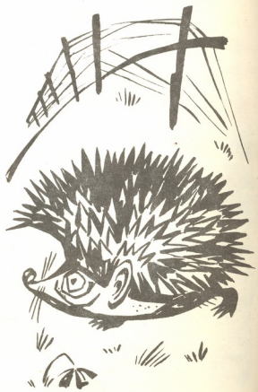
თარგმანი ლილა პრაძისა

დედის წვევლამ გაჭრა; ბატონი ზღარბად იქცა და შთელი სიცოცხლე ასე გაატარა.