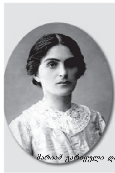
მარიამ გარიყული და გალაკტიონი

დიდი გალაკტიონის დაბადების დღის მთავრობასთან დაკავშირებით, ვთავაზობთ მარიამ გარიყულის მოგონებებს მეფე-პოეტზე.