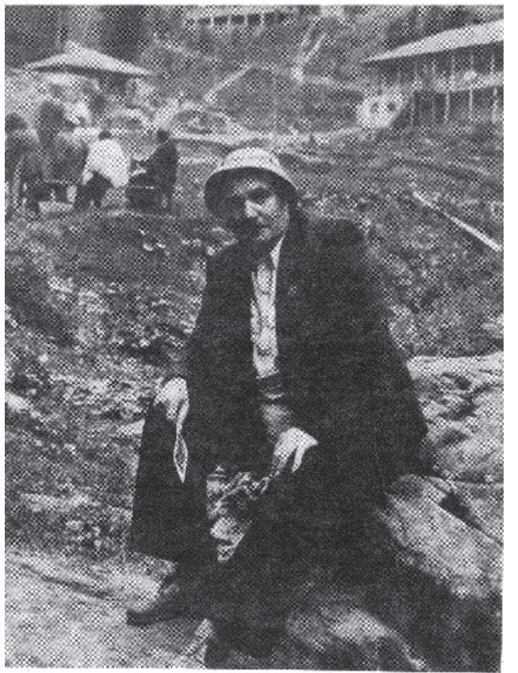
ბაგრატიონი ტაბიძე საჩინოში (1940 წ.).

17 ნოემბერი გალაკტიონ ტაბიძის დაბადების დღეა. მარად ჩვენი თანამედროვეა პოეტი.