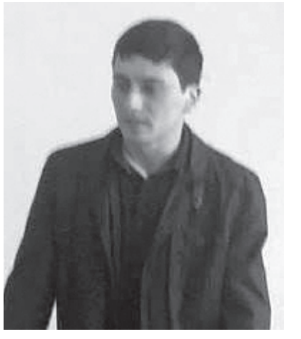
და თქვენი თავი გააცანით საზოგადოებას.