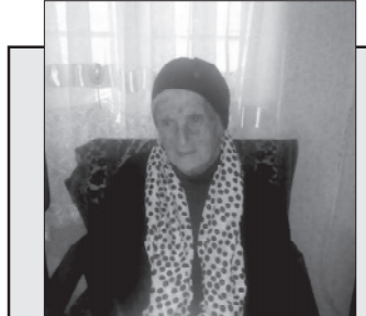
გვიყვარხარ და გვეამაყები, ჩვენი ვალდებულებაა, ჩვენი ვალდებულებაა.

სამტრედიაში, ქაჭკაჭაძის 11-ში გაიხსნა ტურისტული მომსახურების სააგენტო, სადაც უცხოეთში წამსვენებელ მომსახურების სხელი პაკეტი: სასტუმროს ჯავშანი, დახვეწა, ავიაბილეთები. ასევე გაუწევენ კონსულტაციას. ტელ.: 599 74 36 08