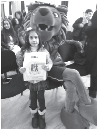
ტელეკულტურული გუნდური თამაშები, სპორტული გუნდური თამაშები და რაგბის მასტერკლასები ქართველი ბორჯღალოსნებისაგან. აგრეთვე, გაუმართეთ შემ-