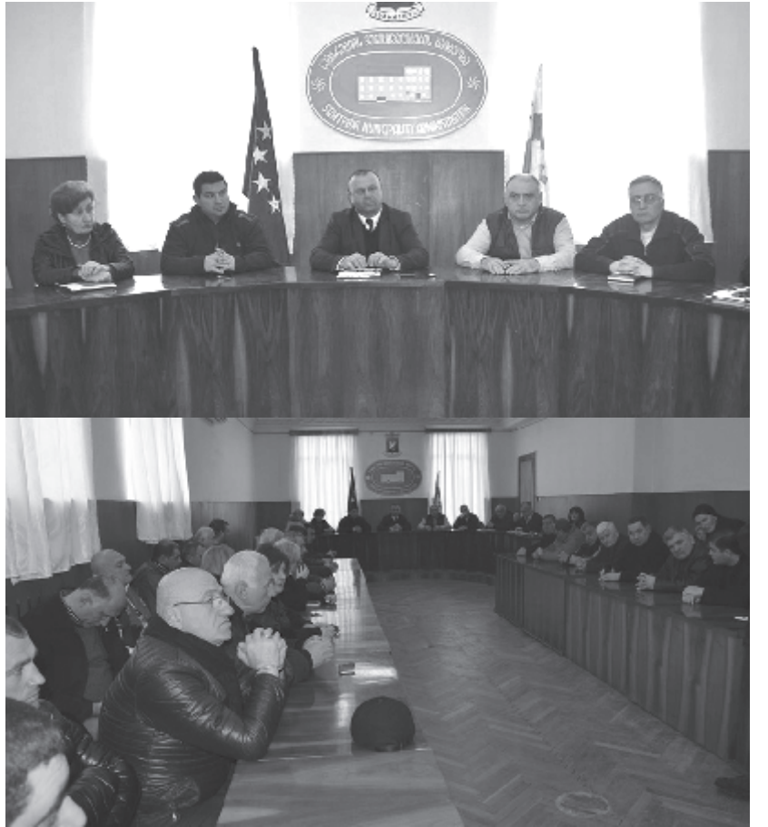
ულში უსახური, ფუნქციადეკარგული ობიექტები, დაუკავშირდით მეპატრონეებს, გამოუვყვლით გასაყიდი ობიექტები. ამი ჩვენს ბიუჯეტში შემოსავალს გავზრდით".

ქრის მოსახლეობა ინტერნეტ პროვაიდერებთან შეხვედრას ითხოვს. პრეტენზია აქვთ, პროექტზე უკუიწივს წვდომა ჰქონდეთ. მუნიციპალიტეტის გამგებელი მოითხოვს, რომ უფუნქციო და უპატრონო ობიექტებს გამოუწინდეს პატრონი და ფუნქცია დაუბრუნდეს: "გთხოვთ, რომ კიდევ უფრო გააქტიურდეთ, მოიძიოთ თქვენს ტერიტორიულ ერთე-