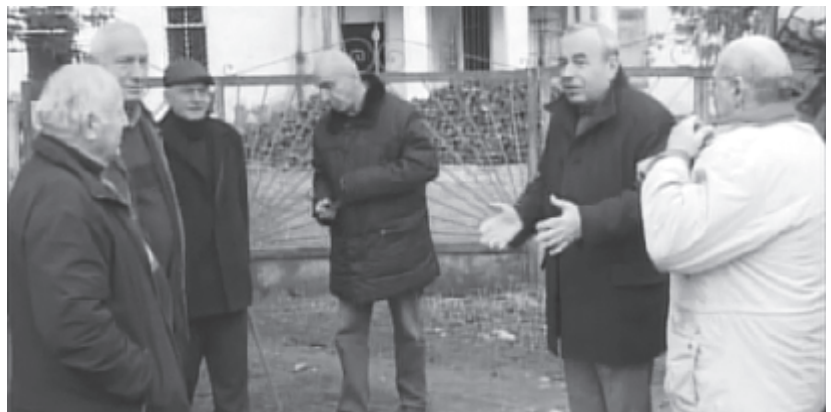
ნობის წინ თავმოყრილ თანასოფელელებს ალექსანდრე ჯვარციანიშვილი. "რაჭა ჩემი სიყვარული" - პოპულარული ქართული ფილმის პერსონაჟების

იანეთის მოსახლეობასთან შეხვედრა კომპრომისით დასრულდა. გადაწყვეტილება ადგილობრივების სასარგებლოდ იქნა მიღებული. შეთანხმდნენ, რომ ალტერნატიული გზა აუცილებლად გავუთდეს, იმის გათვალისწინებით, რომ მოსახლეობას არც საყინე ფართობამდე მისვლა გაუჭირდეს და მოძრაობა მიმეწინაინა ავტომანქანების გადაადგილებამ გლეხობას საძოვარი არ დაუზიანოს.