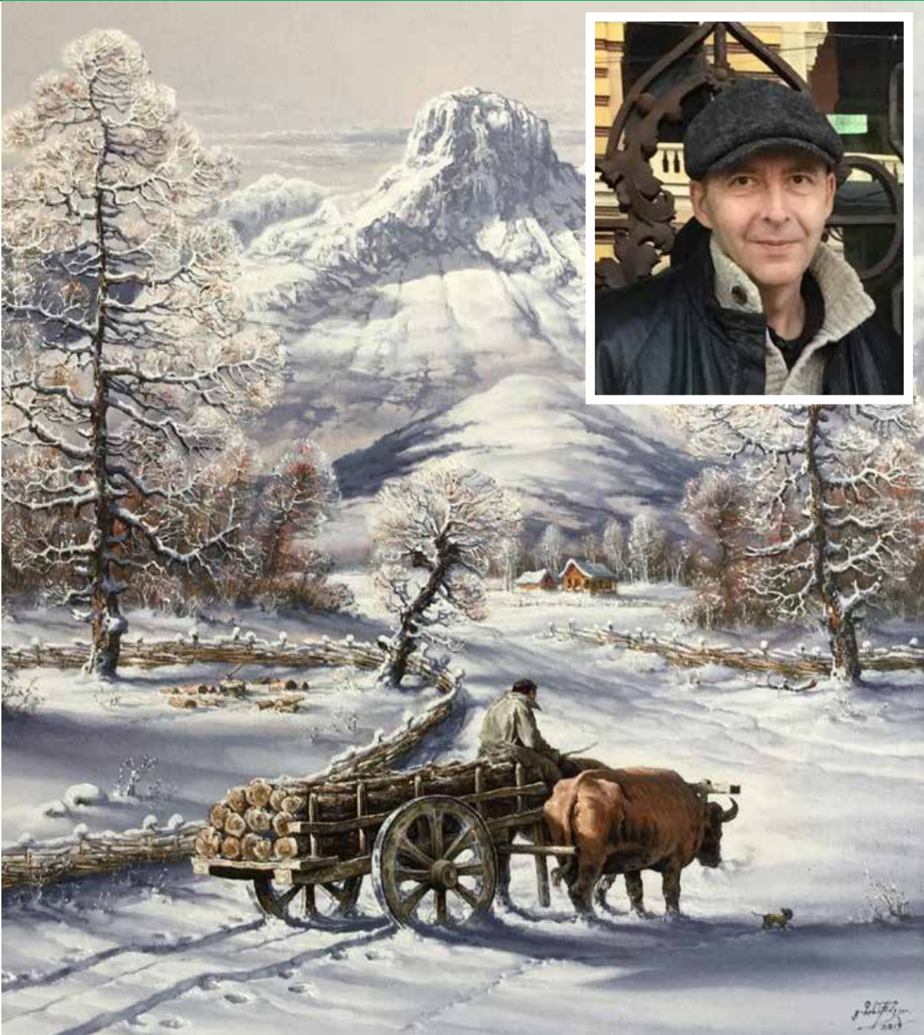
რას ურჩევს ახალგაზრდა მხატვრებს ცნობილი ფერმწერი და საზოგადო მოღვაწე გოჩა ბირაქიშვილი

მიყვარს სხვადასხვა სტილში მუშაობა, იქნება ეს კლასიკა, აბსტრაქცია თუ თანამედროვე, განსხვავებული ტექნიკა. არის მომენტები, როდესაც აღარ მინდა ტილოზე ხატვა და სხვა რაღაცაზე, რაც კი ხელში მომხვდება, გადავდივარ – მოხატვას ან დამუშავებას ვიწყებ. თუ დავინახავ, რომ მეზობელი ძველი სათამაშოების გადაყრას აპირებს, წავართმევ ხოლმე და