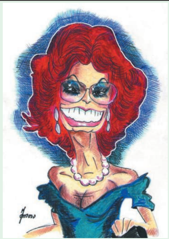
ანალოგიზმობით ტკბობისას შემოიარა მსოფლიო, საქართველოს კი ეწვია წლებშეპარული სოფიო.