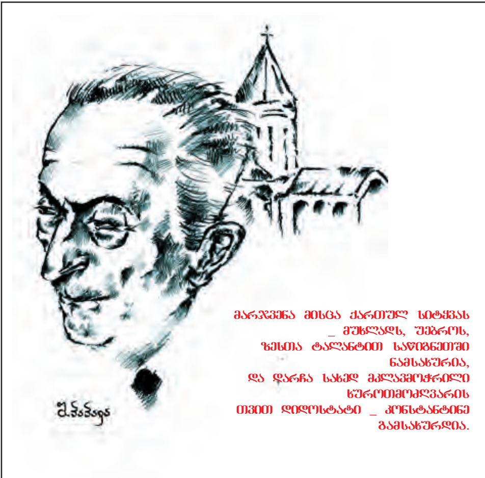
მარჯვენა მისცა ქართულ სიტყვას – მუხლალს, უპირობო, ზმთა ტალახით სავიწარმო ნამსახურია, და დარჩა სახელ მკლამოჭრილი სპროთიოქაპარის თვითი დილოსტატი – კონსტანტინე გამსახურდია.