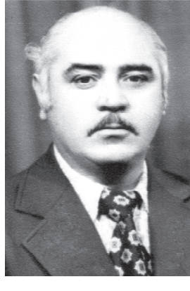
სურათი ავტორის მიერ მომზადებული