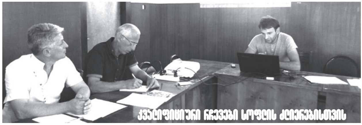
ქვეყნიური რეზერვების კონსერვაცია

ის წყალსადენის მაგისტრალზე 1100 გრძივი მეტრი წყალსადენის მაგისტრალის რეაბილიტაცია ხდება, იღება ძველი, იდგება ახალი. მიუხედავად ასეთი სამუშაოებისა, ვერ აღმოფხვრება მთლიანად პრობლემა. გალმა ზონის მთლიანი მაგისტრალის სიგრძე 200 კილომეტრია. წელს 681 000 ლარის სამუშაოები შესრულდა, საჭიროა 2 მილიონამდე თანხის მოზიდვა, მთლიანად რომ შეიცვალოს წყლის მაგისტრალი. ამის მიუხედავად, მოსახლეობა ამჯერად გაუმჯობესებულ, ხარისხიან წყალს ღებულობს”.