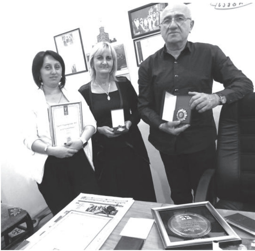
ული ჩამონათვალის რანჟირების შედეგად, ფინანსურ-ეკონომიკური მარჯვენებით, რა თქმა უნდა, შპს "სამტრედ-

თემა გაგზავნილი... წლების სიმრავლეს ერთი მიმართულება, მისი გახდება "სამტრედიის მაცნე"!