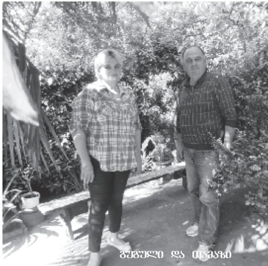
გაგაუი და მისგანი

ეული ბევრი უფლება დაუბრუნდეს, ანუ "სადაც ბავშვის თავისუფლებაზე საუბრობენ, იქ პედაგოგის, უფრო მეტიც, მშობლის უფლებაც იყოს გათვალისწინებული. არც ერთ უფლებამოსეულს ბავშვი იმაზე მეტად არ უყვარს, ვიდრე მშობელს შვილი და თუნდაც, მასწავლებელს მოსწავლე. ბავშვის დასახსიანების მომხრე,