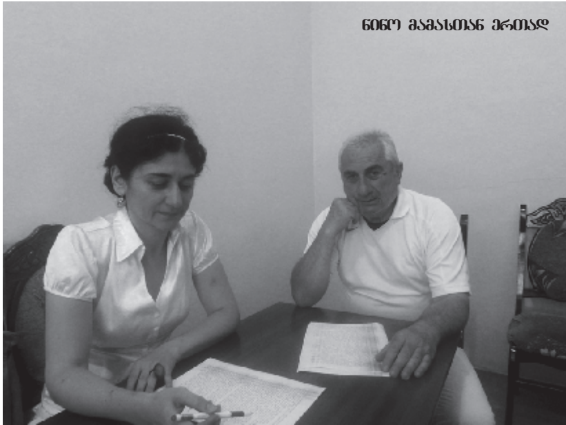
606R მამასთან ერთად

თარი თავით. არ მოგწონს სხვისი გაკეთებული? მაშინ შენ გააკეთე. არ მოგწონს სხვისი დარგული ხე, ყვავილი? შენ დარგე და გაახარე, იმის წაითხუელი და დაწერილი არ მოგწონს? შენ დაწერე და წაიკითხე. კრიტიკაც არ ჰქვია იმას, რაც დღეს აქ ხდება. ვინც გაკრიტიკებს, უფრო ჭკვიანი უნდა იყოს. კრიტიკა ყოველთვის მიახასიალმებელია, სარკანშით აშენებული და გაკეთებული კი ჯერ არაფერი მინახავს, ასე წინ ვერ წავაბო! ყველა ელოდებოდა, რომ ვიღაც მოვა და მათ ქალაქს, ქვეყანას ვიღაც უშვალის. ამ დროს სხვა ვერაფერი, შენს თავს თვითონ უნდა უშვლო”.