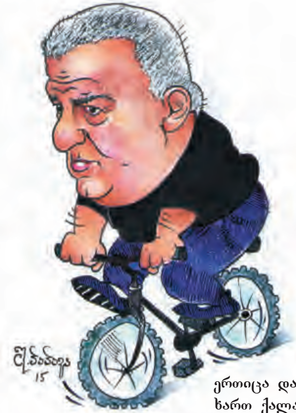
ერთიცა და მეორეც ხართ ქალაქის "გენია", სამტრედია უთქვენოდ ვერ წარმოვიდგენია!