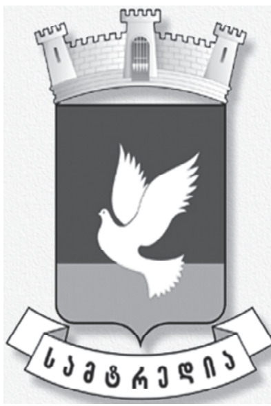
ბი ჩვენი ქალაქის ზრდა-განვითარების მნიშვნელოვან მომენტებს რომ ასახავს.

ქალაქ სამტრედიის დაარსების 145-ე წლისთავის მოახლოებასთან დაკავშირებით გადაწყვიტეთ, დაინტერესებულთათვის ერთხელ კიდევ მოგვეგონება, ახალგაზრდებისათვის გაგვეცნო ის ძირითადი თარიღები, მოვლენები, ფაქტე-