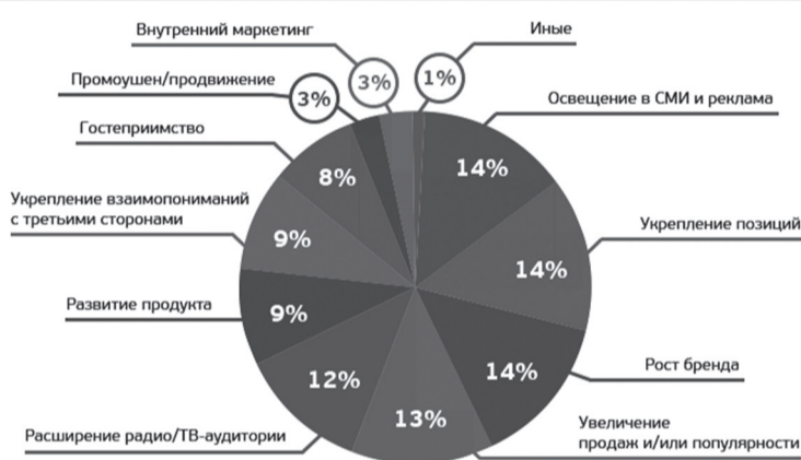
Рейтинг выгод от event-маркетинга

Мы часто становимся невольными участниками различных мероприятий, которые связаны как с рабочим процессом, так и с досугом – конференции, конгрессы, выставки или другие информационно-познавательные события (ярмарки, турниры, праздники, фестивали, концерты).