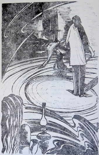
მხატვარი ბ. შატაშვილი