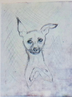
ლიან მამულაძე, „წიწი სხეული“. 14 წ. 58 ს.მ. ს.ქ.