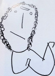
მიწისა იუკარაძე, „აბიჯი და ყივნი“. 8 წ.