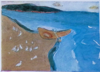
დათო ჯალღაძე, „ნაპი“. 12 წ. 126 ს.მ. სკ.