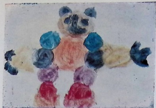
პანანია ლხინჯილიძე. „ღათუნა“.