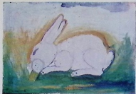
ირაკლი შარტავაძე, „კარდღელი“. 12 წ. 42 ს.მ. სკ.