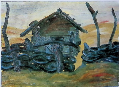
ლევან პანინის მიერ „კვირის“ 14 წ. 58 სმ. სკ.