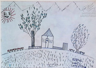
ბიბი აბრამიძე. „პეპინს სხელი სოფელში“. 6 წ.