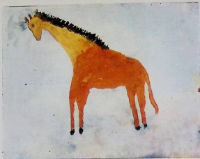
ნატაშა კოკოვა, „გირაფა“.