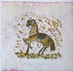
შორაძის კახარაძე, „ცხენი“. 8 წ. 61 ს.მ. ს.ქ.