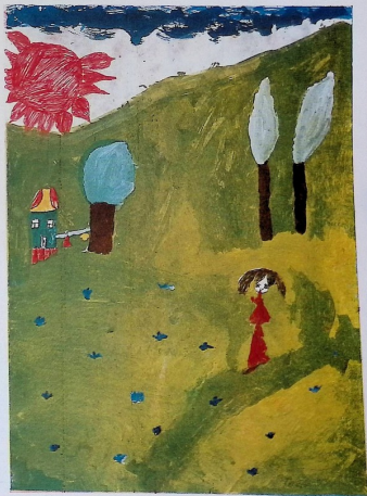
ანი ბგულაშვილი. „კაიზაში“. 7 წ. მეორე ვახანგრძლ. სკ.