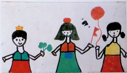
ნანა თოდუაძე. „სამი გოგონა“. 8 წ. 12 ხაზ. სკ.