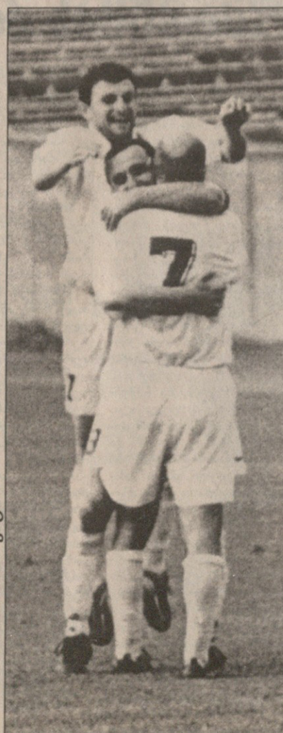
ტორპედოელები მესამე გოლის შემდეგ