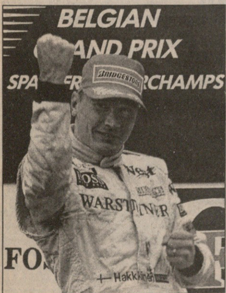
სპასიბოსგან დარჩა სპა