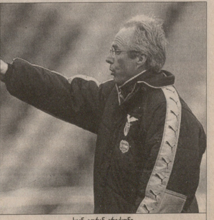
სვენ გორან ერიკსონი