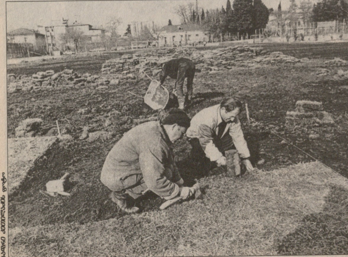
„ნორჩი დინამოელი“ მოედანზე ახალა უკვე ლაგოდესური მწვანე მინდორი ბიბინებს