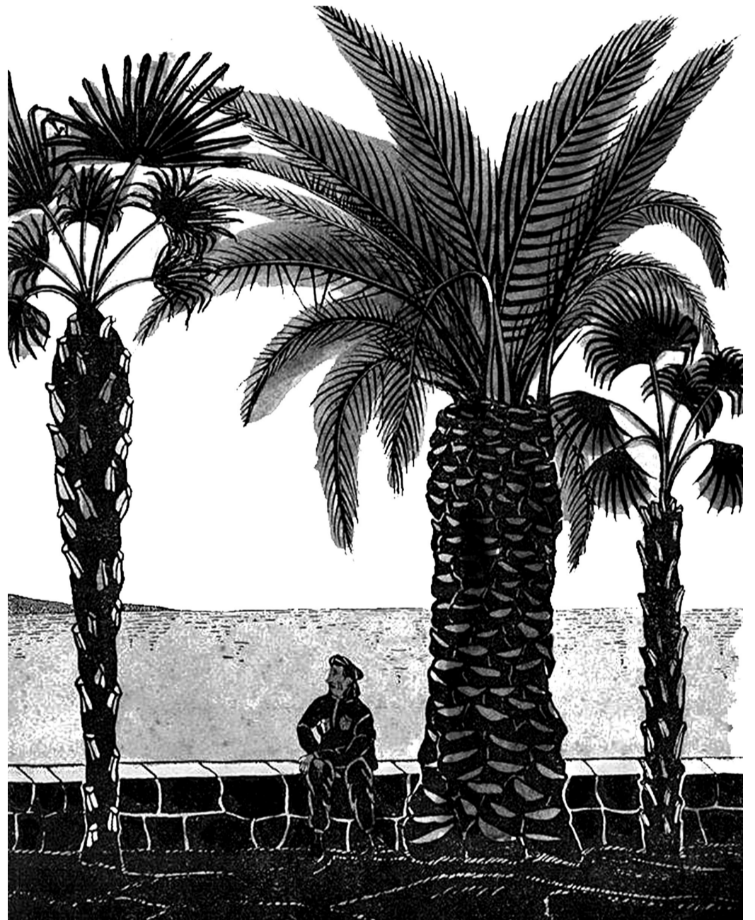
В. Благовещенский. АБХАЗИЯ. СУХУМ. Набережная.

В столице Абхазии экологи обнаружили 7 пальм, пораженных вредителем. Все их придется ликвидировать и сжечь во избежание дальнейшего распространения насекомого. Спасти такие деревья уже нельзя. Присутствие вредителя зачастую становится заметным только уже на погибающем растении.