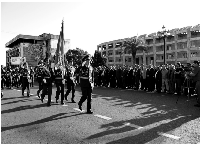
Анатоли Салакаиа-Ацъа аветеран, Ацсны Ацынцтәылатә еибашьра атыл аусзуф.

Аиааира 25 шықәса ахытцра аламталаз абака аартра иалахәыз рахьтә азәык-шыцъак хьыцәажәаз иазгәартон: