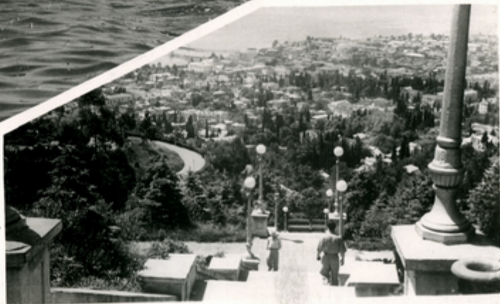
კადვანის სანო სომხის მდორა.