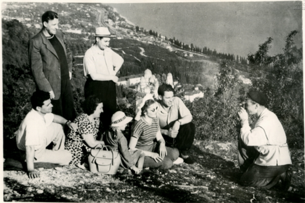
ახალ ათონში მზარისვები ემსოიან კაროკს. ახეოზან ბანეიანებან იზაკიონ ამოზე რა ამოილი რლით ამოიან სო- ზანს, სარან ამოვილიანებან ქალაქის ლიანსესანიშნან პევილიანს. საკამოზე: მზარისვები ახალ ათონში.