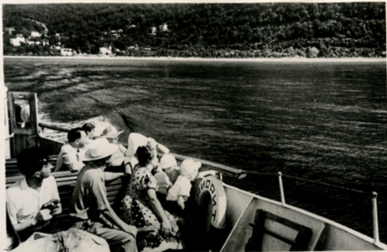
ბიჭვინთის უბნის, აკონსტანტინოპოლის ნაპირის სანაპირო ნაპირი.