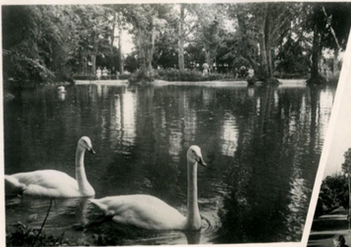
მადრიდის პარკში სამაგისტროს

მაგისტროს უმჯობესი დროს ზედასწავლის მომართულებას ექსპერიმენტ- სა და სტატისტიკური კვლევებისა და ზღვრისკენი კვლევით, მდინარე სი- ნაპლის ხეობაში მდებარეობს მთაზე და ავსტრალიანთა—გალაქის მთის ჩინის ზედაზე.