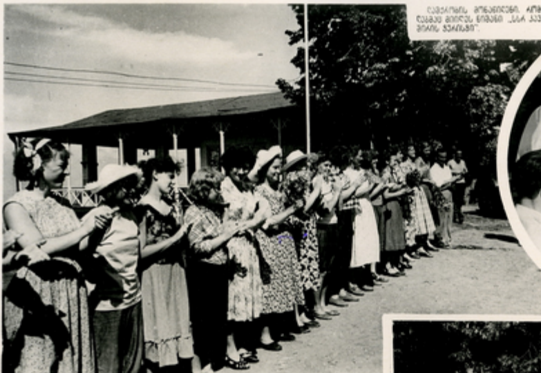
საბავშვო ბუნების, ან- ტონო ბიძის ფილია „სა სს- პარე სკოლაში“.