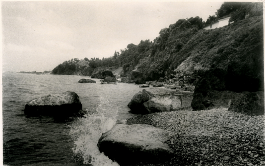
გათაშის ახლომდებარე კურორტი უბინოსანი. აქ ჩაშენდა ვანის ვანის ათვალითაგან ჯანსაღების კურორტი, ძველი უბინოს ნანგრევები, სიღინაშ სანს სანსიკო ქალაქისა და ზღვის სანსიკო ხეივანი. სანსიკო: უბინოსანი სანსიკო.