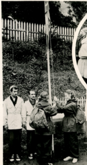
ԸՆԴՄՈՒՆ ԷՋԵՑԱՆ ԵՄԵ յՈՒՆ ՅՐԿԱՅԵՆՆԵՐ

ՅՐԿԱՅԵՆՆԵՐ ԿՐԹՈՒԹՅԱՆ ՄԻՆԻՍՏԵՐԱՆԻ ԿՐԹԱԳԻՏՈՒԹՅԱՆ ՆԱԽԱՐԱՐՈՒԹՅԱՆ ԿՐԹԱԳԻՏՈՒ ԹՅԱՆ ԷՋԵՑԱՆ ԵՄԵ յՈՒՆ ՅՐԿԱՅԵՆՆԵՐ