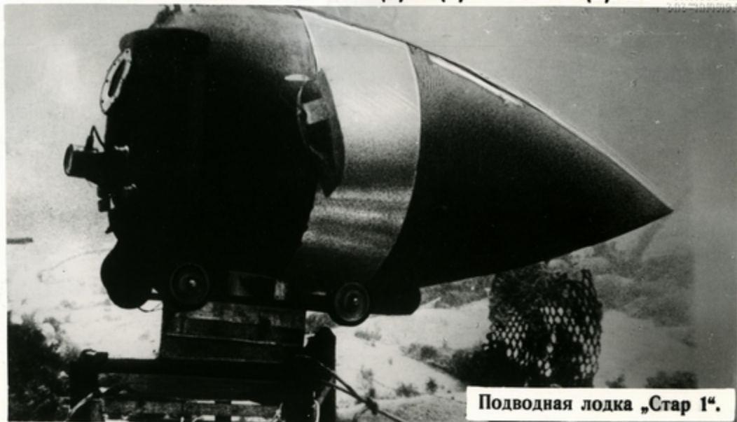
Подводная лодка „Стар 1“.

А МЕРИКАНСКАЯ фирма „Дженерал Динамикс Электрик Боут Дивижн“ построила подводное судно, предназначенное для поисков кораблей и подводных лодок, потерпевших крушение. „Стар 1“ (так называется судно)—небольших размеров, он очень удобный, подвижный и легкий. Благодаря этому его без труда можно доставить из одного пункта в другой по воздуху и по суше.