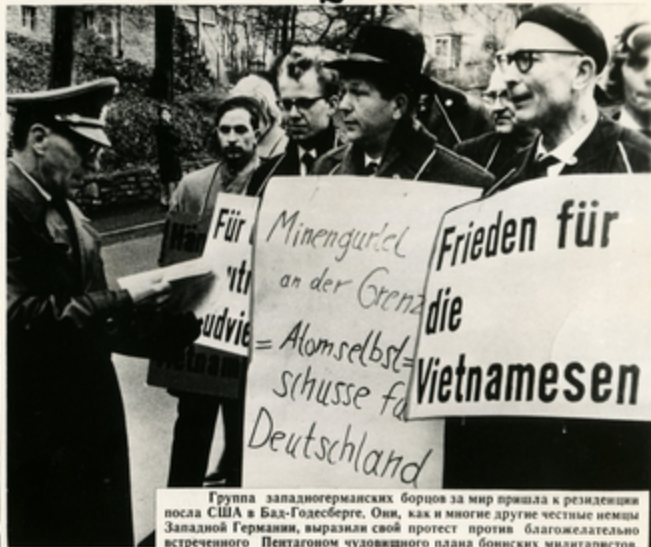
Группа западногерманских борцов за мир пришла к резиденции посла США в Бад-Годесберге. Они, как и многие другие честные немцы Западной Германии, выразили свой протест против благожелательно встреченного Пентагоном чудовищного плана боннских милитаристов.

ЕДИНОДУШНОЕ осуждение западногерманской общественности вызвали недавно ставшие известными планы военных руководителей ФРГ о создании на границе с ГДР «пояса атомных мин».