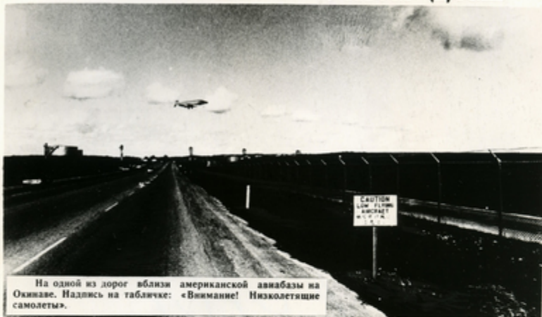
На одной из дорог вблизи американской авиабазы на Окинаве. Надпись на табличке: «Внимание! Низколетящие самолеты».