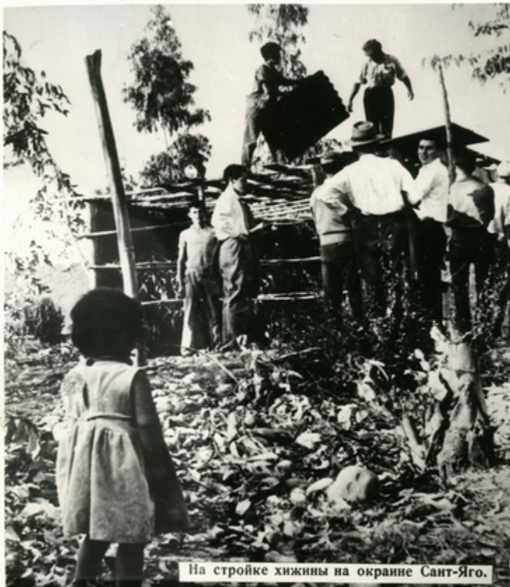
На стройке хижины на окраине Сант-Яго.

В ЧИЛИ существует обычай. Если бедняк на пустыре успел поставить крышу до прихода полиции, то он может выстроить на этом месте хибару. Конечно, надо торопиться пока дремлют власти. Обычно вся семья, включая и малолетних, участвует в этом „строительстве“.