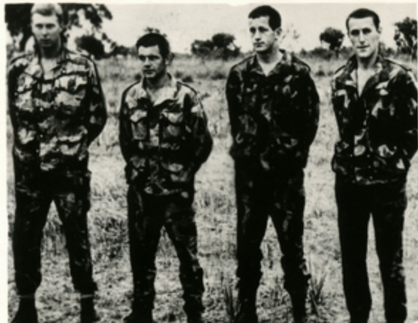
Четверо наемников—два из Англии, один из Южно-Африканской Республики и один из Южной Родезии.

Д ЛЯ борьбы против повстанческого движения в Конго Моиз Чомбе вербует банды белых наемников. Ради денег они готовы на любые преступления.