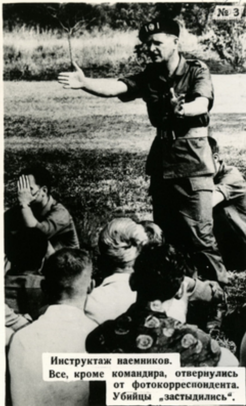
Инструктаж наемников. Все, кроме командира, отвернулись от фотокорреспондента. Убийцы „застыдились“.

Белые наемники Чомбе прибывают в Конго из Южно-Африканской Республики, Южной Родезии, Англии, Западной Германии, Франции. Некоторые из них скрывают свои фамилии, другие афишируют свою принадлежность к ландскнехтам.