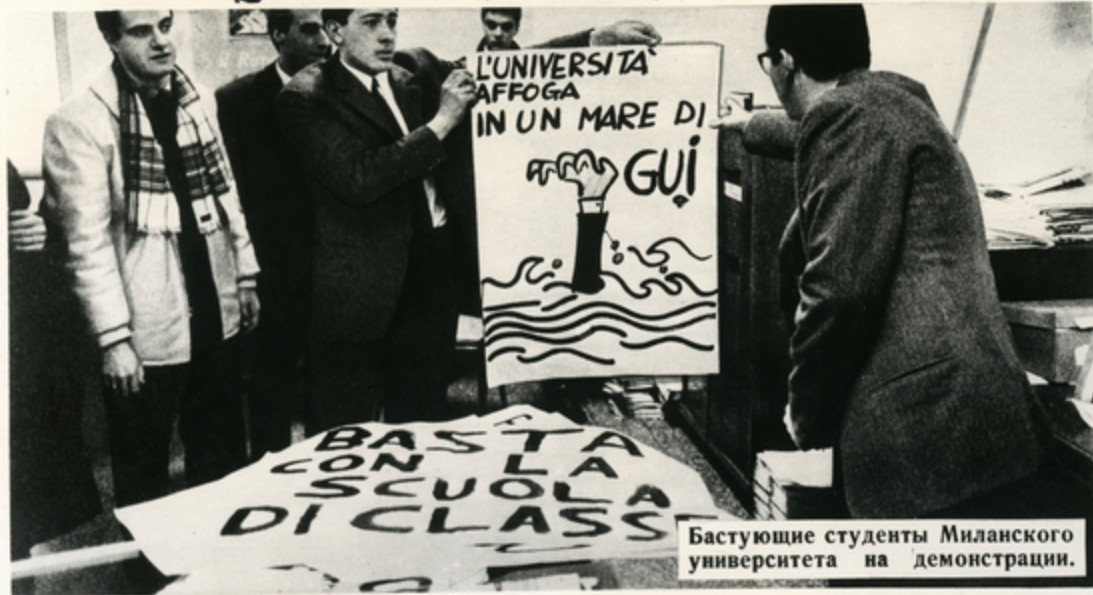
Бастующие студенты Миланского университета на демонстрации.

ИТАЛЬЯНСКИЕ студенты выступают против так называемого „плана для школы“, разработанного министерством просвещения. Этот реакционный план предусматривает увеличение влияния церкви в учебных заведениях и совершенно недостаточные ассигнования на народное образование. Возмущение студентов вызывает предполагаемое повышение платы за обучение в высшей школе.