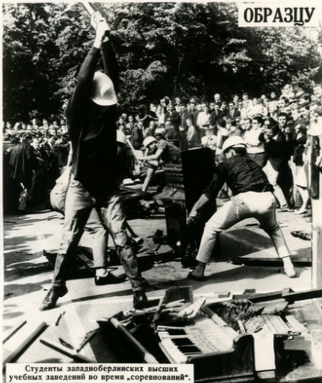
Студенты западноберлинских высших учебных заведений во время „соревнований“.

НЕДАВНО в Западном Берлине было проведено соревнование по американскому образцу „на превращение пианино в щепки“. В соревнованиях участвовали команды технического университета, высшей педагогической школы и так называемого свободного университета. Особенно усердствовали студенты свободного университета. Они превратили пианино в щепки за 12 минут. Это, правда, ниже американских рекордов, но можно надеяться, что молодцы из западноберлинских высших учебных заведений догонят своих американских коллег.