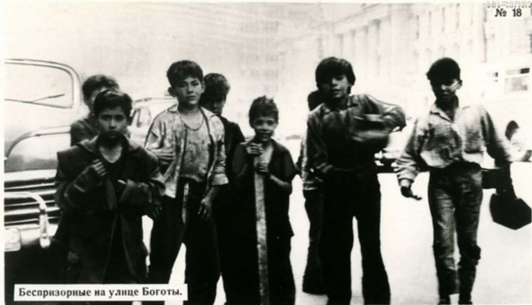
Беспризорные на улице Боготы.

ПО УЛИЦАМ городов Колумбии бродят многие тысячи беспризорных детей. Одни лишились родителей, другие убежали из дома в поисках лучшей жизни. Они занимаются попрошайничеством и мелкими кражами. Нередко питаются объедками, укрываются газетами, спят на улицах или в полицейских участках. Из года в год растет в стране детская преступность.