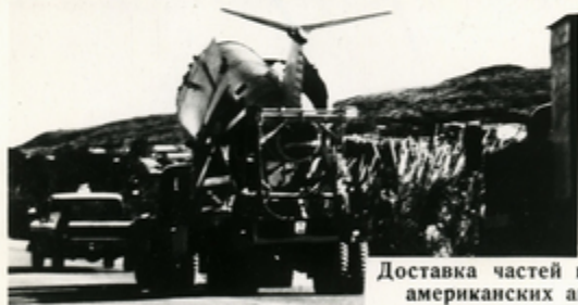
Доставка частей вертолета на одну из американских авиабаз на Окинаве.

П О дорогам японского острова Окинава грохочут танки и бронетранспортеры армии США, на аэродромах — военные американские самолеты. Прошло 20 лет после окончания войны, но Окинава все еще остается под американским управлением.