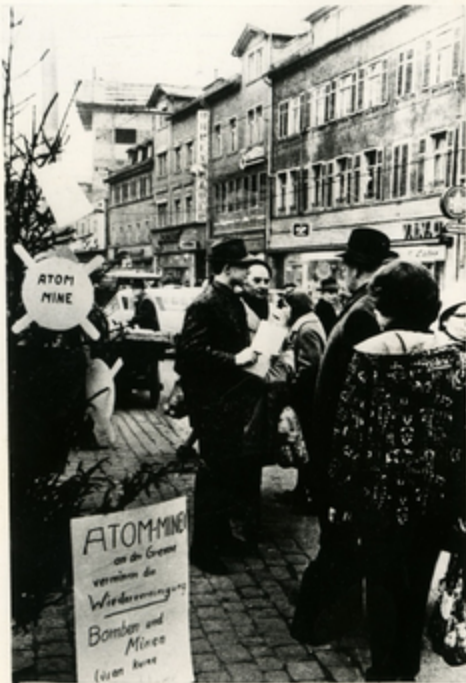
Сбор подписей под заявлением протеста на улице в Offenbach. Надпись на плакате: «Атомные мины на границе подкладывают мины под воссоединение. Бомбы и мины не решают проблем».