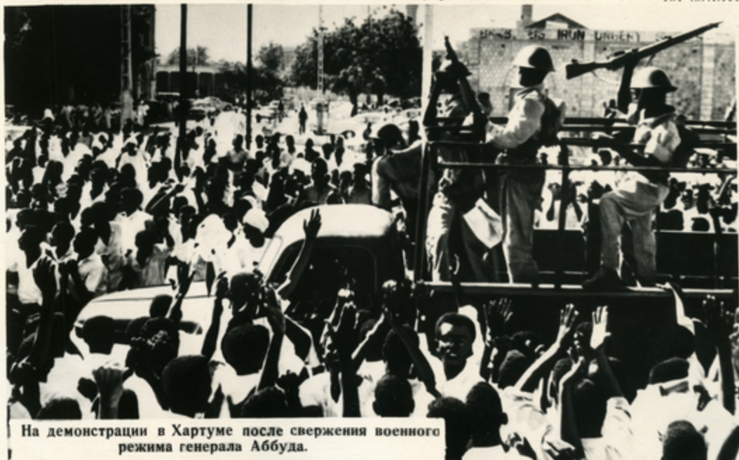
На демонстрации в Хартуме после свержения военного режима генерала Аббуда.

1 ЯНВАРЯ Судан отметил 9-ю годовщину своей независимости. Ныне этот праздник особенно радостен, ибо страна сбросила военную диктатуру и встает на путь демократического развития. Советские люди желают суданскому народу полного успеха во всех его делах и чаяниях. № 8