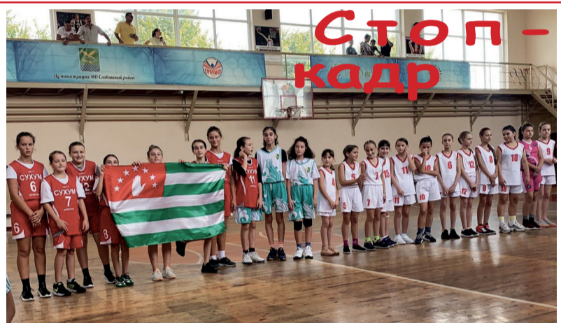
Команда баскетбольного клуба «Спартак» Управления по делам молодежи и спорта Администрации Сухума заняла второе место в открытом турнире МАУ СШ «Триумф» среди девушек 2008-2010г.р. и моложе. Турнир проходил с 10 по 12 сентября 2021г. в г. Славянск-на-Кубани. Лучшим