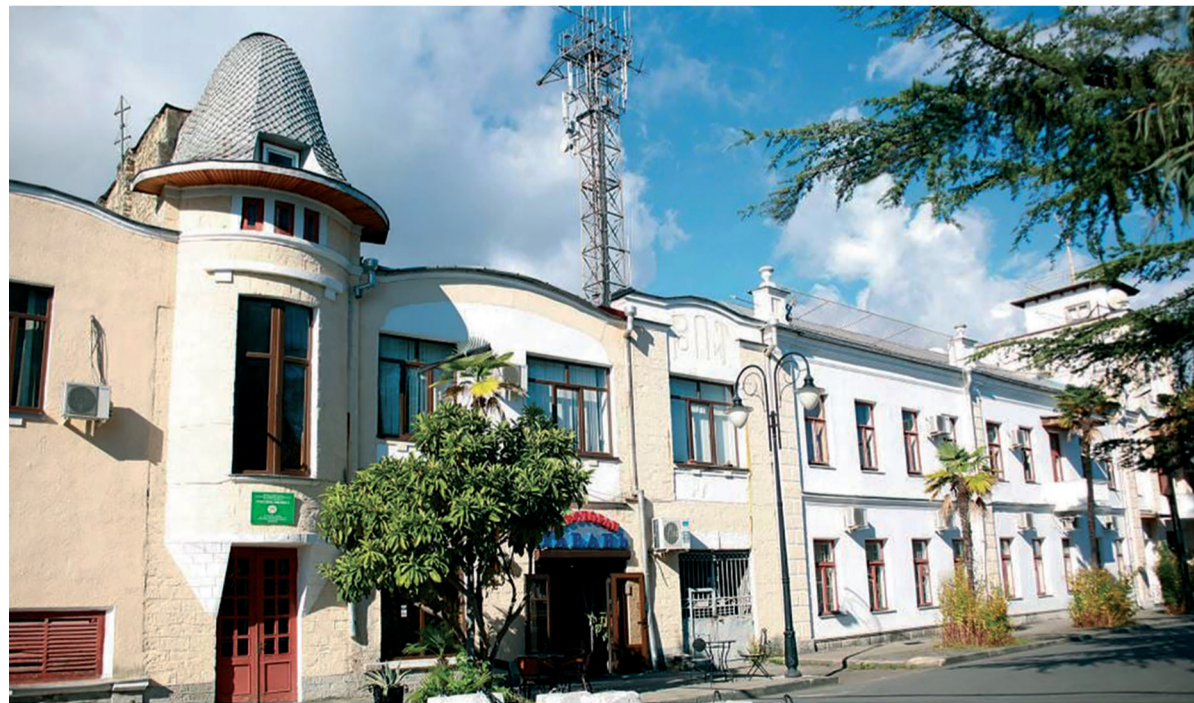
Бывшее здание Сухумского агентства Русского Общества Пароходства и Торговли (РОПиТ). Набережная Махаджиров, 68

Из книги Анзора Агумаа "Старый Сухум" 2016 г.