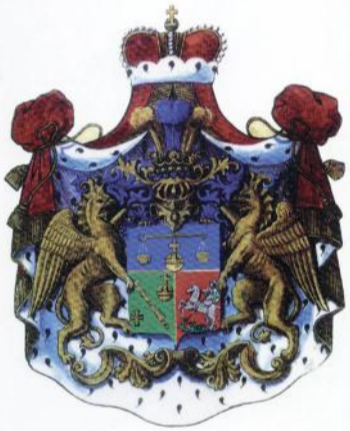
Герб рода Чачба

Так наши предки отстаивали свободу и независимость своей Родины.