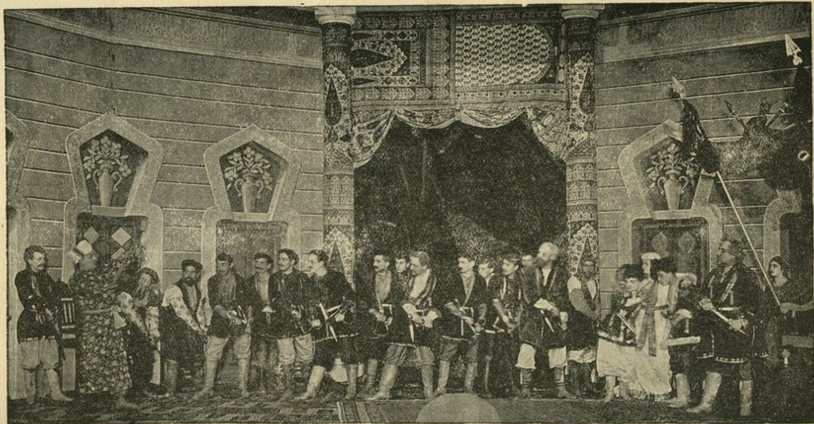
მესამე სურათი: დავრიში ზირაბისამებრ თხულობს შეფუ-დედოფლისგან შვილს—ტეუზის ცაღს.