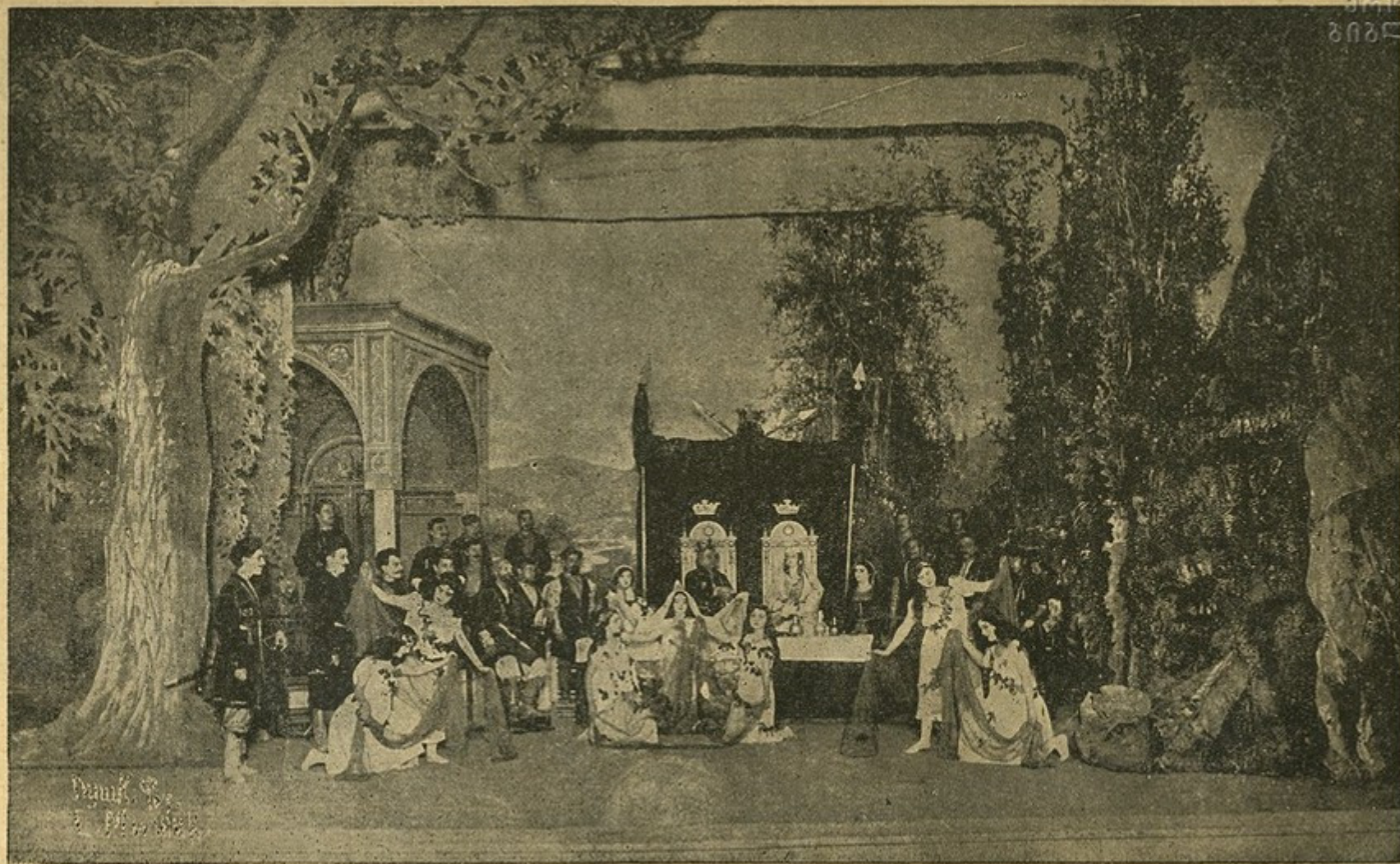
სურათი პირველი: მეფის ჯიშურის ღვინო და ფერების ცეკვა.