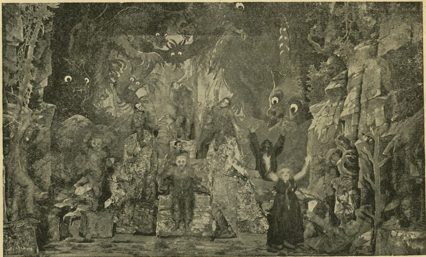
ჯოჯოხეთი, მეოთხე სურათი.