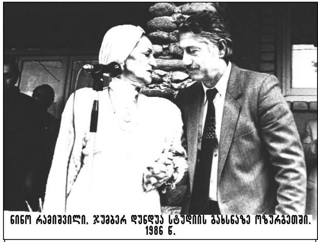
ნიწო რაიკომიწი. ჯუმბერ ღუნდუა სტალიწს განსწაზოზურგეთში. 1986 წ.

გამორჩეულობა, განუმეორებლობა! მეცადინეობები შეუსვენებლოვ, განუწყვეტლოვ...ქორეოგრაფი ჯუმბერ ღუნდუა მყურებელთა გულის მყრობელი გახდა.