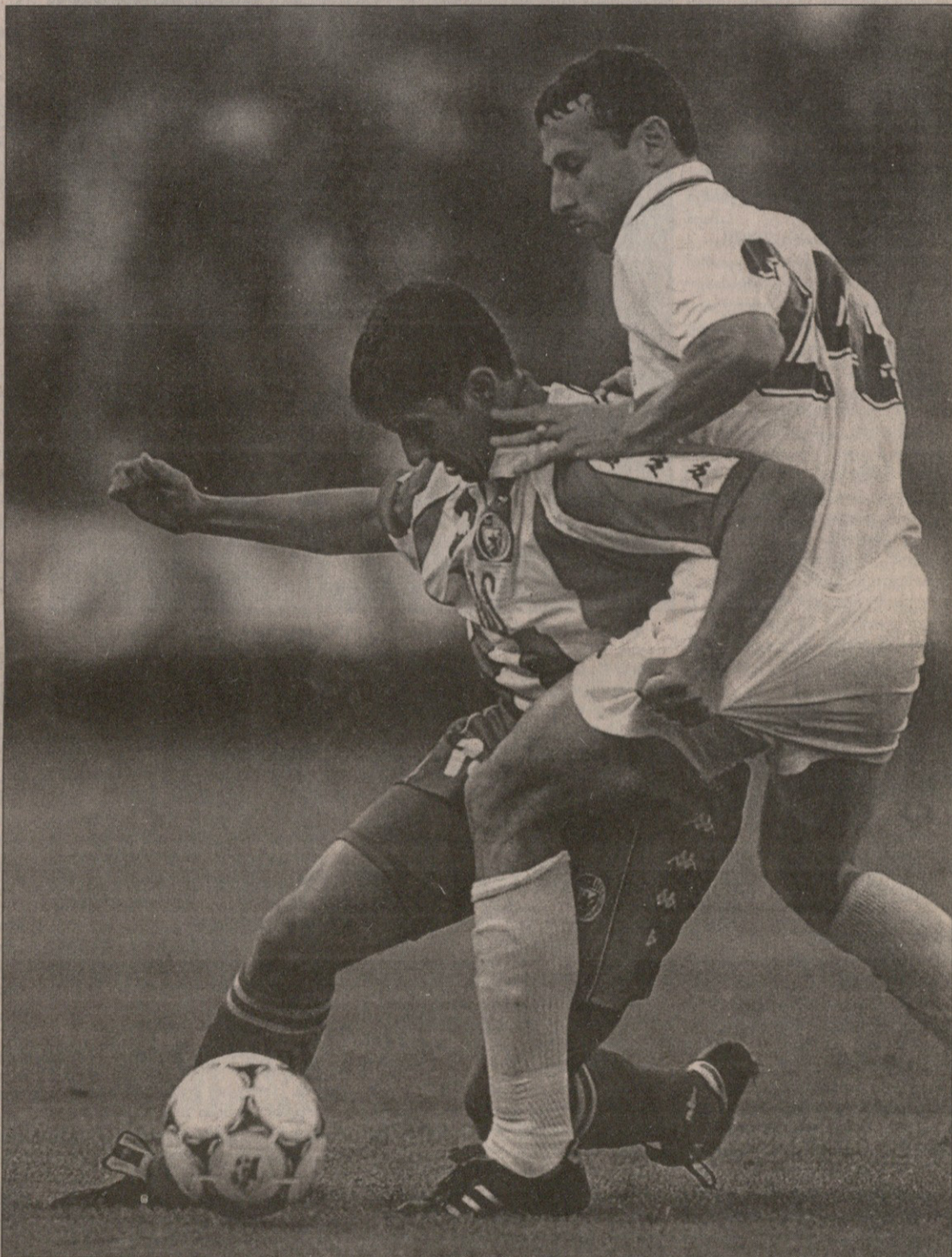
ტრვენა ზვეზდა — ტორკედო 4:0. მასპინძელთაგან საუკეთესო მიხაილო პიანოვიჩმა გაიტანა ხედაგიანი (№24) და მისი პარტნიორები გვარიანად გაამწარა