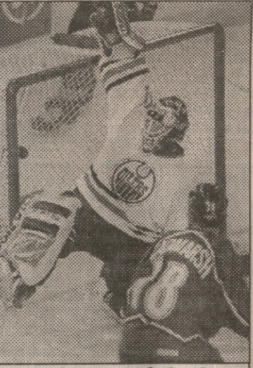
კოლორადო — ედმონტონი. კოლორადოელი დედმარშის მეორე გოლი ედმონტონის კარში

სერიის დაწყებამდე ნიუჯერსელები იმედინად იყვნენ და მხოლოდ ალექსი იაშინის განეიტრალება ადარებდათ. არცთუ ტყუილად — რუსმა ფორვარდმა ააწიოკა ლიგის საუკეთესო დაცვა და სერიის მესამე შეხვედრაში მის მიერ გატანილი გადაწყვეტილი გოლიც სრულიად ლოგიკურად გამოიყურება. ამ წყვილის ორთაბრძოლა, ისევე როგორც დეტროიტისა და ფინიქსისა, ვერაჯერობით ყველაზე მოულოდნელად მიმდინარეობს.