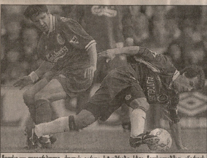
ჩეხეთი — ლივიპოლი. ძოლა გარდა სტუმრები სხვა ჩეხლებმა ანდრეს

ვკაცო გლენ ჰოლი მსოფლიოს ჩემპიონატზე გასამზარებელი გუნდის წევრობის კანდიდატებს ვაკუსებრება. მათამდე ჰოლს 58 ფეხბურთელი ჰყავდა შეგულელებო, მაგრამ ჰაკერიბის პეტი-თიტი რომ იხილა, ნაკრების სემინარებზე 59-ედ ისიც მიიწვია.