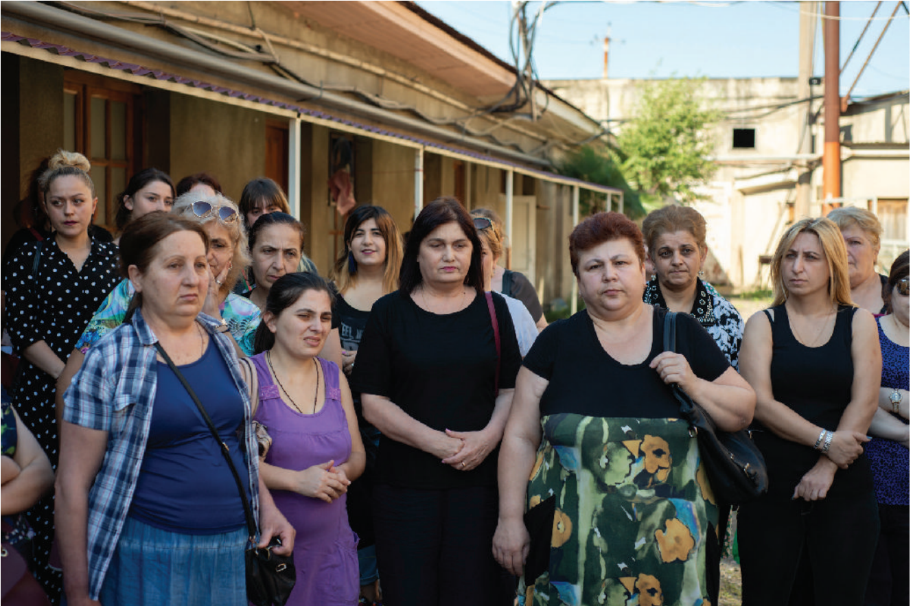
ქალები დილაადრიან იკრიბებიან საწარმოს წინ, რომ გაიგონ, გადაუხდიან, თუ არა ხელფასებს.

15 ივლისს ქუთაისში „ქუთექსის“ ქარხნის წინ თითქმის 120-ვე თანამშრომელი შეიკრიბა, რომ გამოეხატათ უკმაყოფილება ყველა დარღვევით, რაც მენეჯმენტისგან განიცადეს: დაგვიანებული ხელფასები, ხელმძღვანელობის გაუკრვეველი სტრუქტურა და იძულებითი მოცდენა.