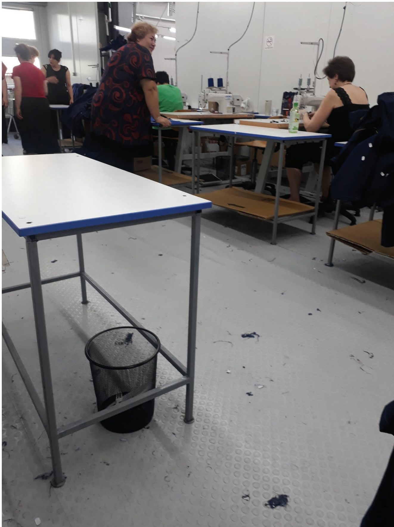
ფაბრიკის იატაკი ყოველთვის ჭუჭყიანია. დამლაგებელი დღეში ერთხელ, დილაობით, მოდის.