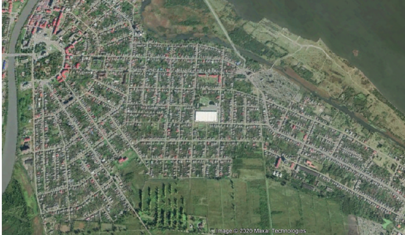
„აჭარა ტექსტილი“ (თეთრი ოთხკუთხედი) ფოთის რამდენიმე სამუშაო ადგილიდან ერთერთია.

ან პენსიონერი ხართ და წვალებით ეძებთ შემოსავალს, რომ ოჯახს ტვირთად არ დაანვეთ.