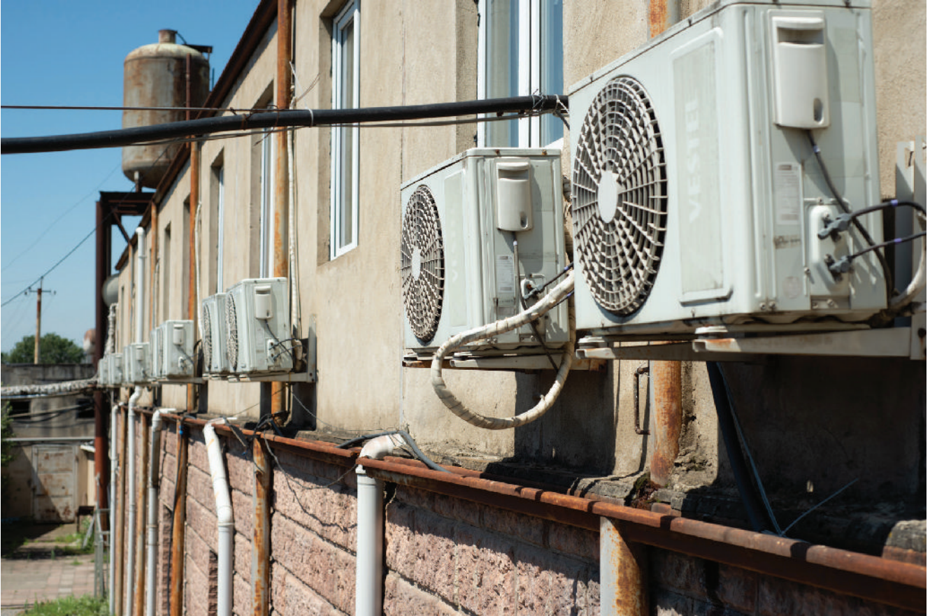
„ქუთეისში“ კონდიციონერებით მხოლოდ ადმინისტრაციის ოფისები გრილდება.

ნათელია, რომ ბევრი მათგანი შედეგს დღესვე ელოდებოდა, თუმცა საბოლოოდ დასაქმებულები ახერხებენ, იმედგაცრუება გადალახონ და პირველად პროფესიულ კავშირს აყალიბებენ. ჯერ-ჯერობით გაერთიანება ყველას სურს – თუმცა უცნობია, რამდენად შეინარჩუნებენ ამ ერთობას, რამდენად გაინაწილებენ პასუხისმგებლობას კავშირის კომიტეტში, შეძლებენ თუ არა, უარი თქვან მოკლევადიან გარიგებებზე და გაუძლონ კომპანიის წნეხს.