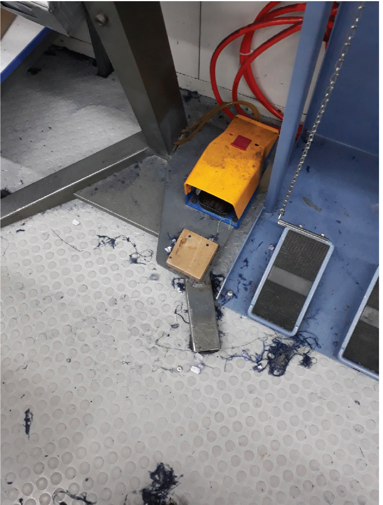
მანქანები ხშირად ფუჭდება დაგროვებული მტვრის გამო.