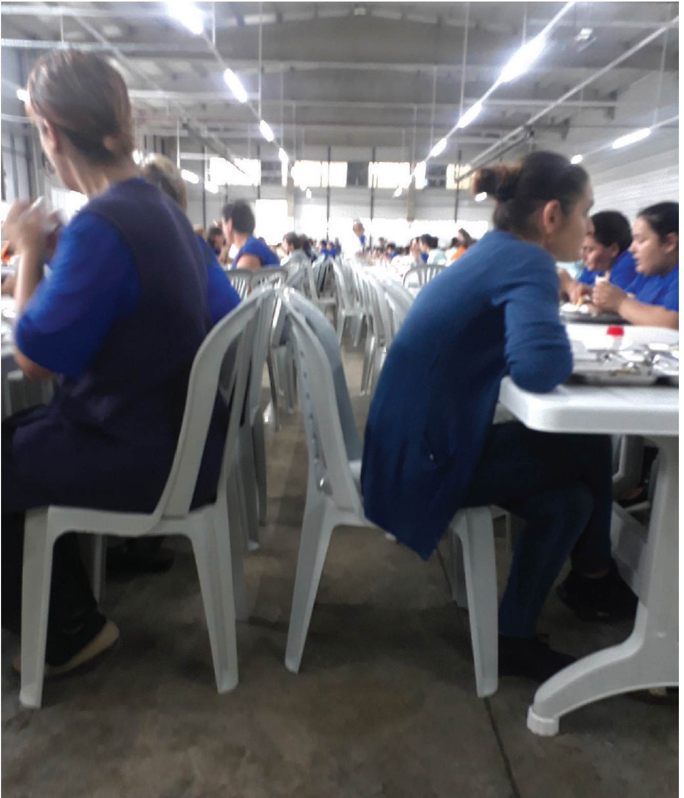
ფორმის გარეშე გამოცხადება „აჭარა ტექსტილში“ დისციპლინის დარღვევად ითვლება.

ყველაზე რთული დისციპლინის ბონუსია. აქ დარღვევების ჩამონათვალი უსაშველოა, თითოეული 2 ლარს გაკლებს, თუმცა არის ხუთლარიანებიც. ეს დარღვევები უკიდურესად სპეციფიკურიდან საკმაოდ ზოგადამდე მერყეობს. მაგალითად, ბრიგადირის მითითების არშესრულება ან შეცდომის არშემჩნევა.