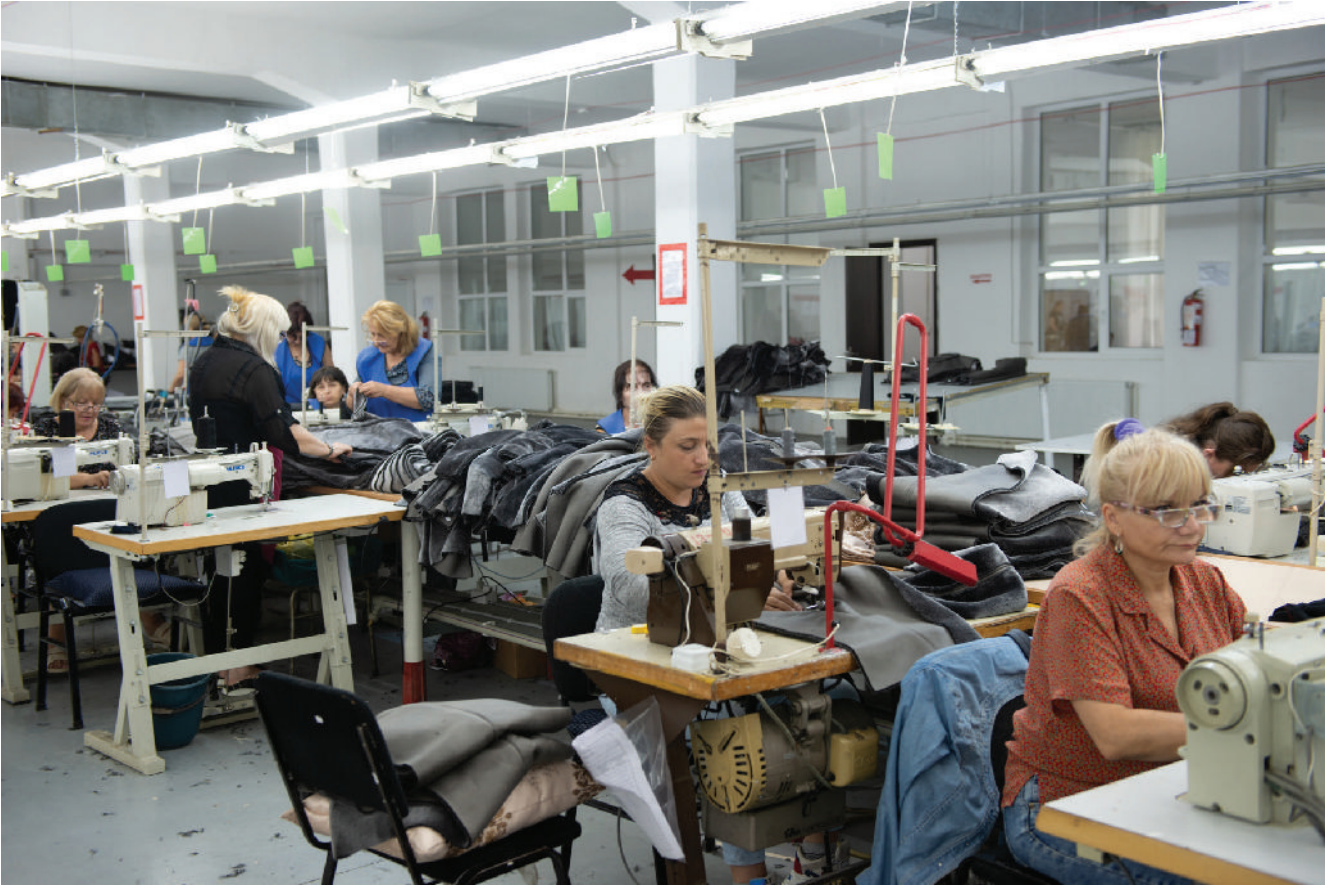
„გვინდა, დადებითი განწყობა იყოს ქარხანაში“, – იმერის ბრიგადირი ქარხნის შემოვლისას.

ყოფილმა მკერავმა, რომელიც ამჟამად საფრანგეთშია წასული, OC Media-ს უამბო, რომ მისი გამოცდილებით, კომპანია არც თუ ისე მეგობრული იყო მშრომელთა მიმართ.