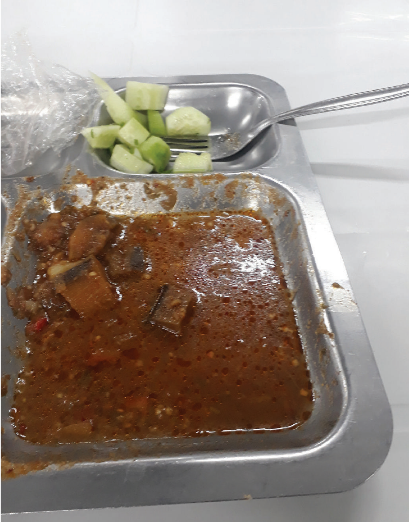
„აჭარა ტექსტილში“ სადილი უფასოა, თუმცა არც ისე ნოყიერი.