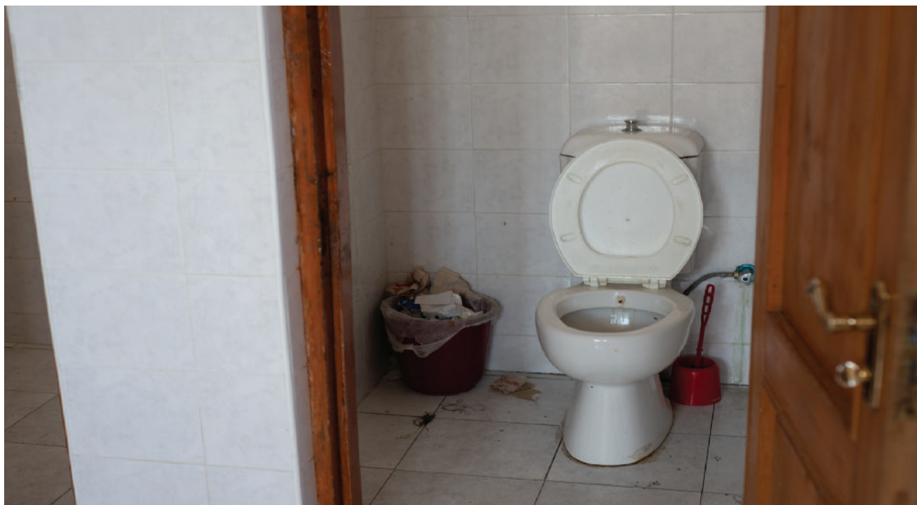
„ქუთეხსში“ ტუალეტის კარები არ იკეტება, ტუალეტის ქაღალდი კი ყველას თავისი მოაქვს.