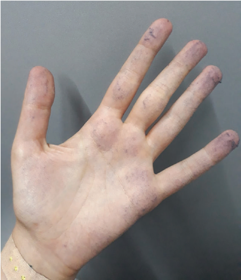
ჯინსებთან მუშაობისას ლურჯი მტვერი წარმოიქმნება, რომელიც ყველა ზედაპირზე რჩება, მათ შორის დასაქმებულთა ხელებზეც.

გერმანული ბრენდის, Uvex -ის, დამცავ შარვლებზე ვმუშაობდით. ჯინსისმაგვარი სქელი ქსოვილისგან მთელ სახელოსნოში ლურჯი მტვერი რჩებოდა. ჯერაც არ მინდა იმაზე ფიქრი, ჩემს ფილტვებში რამდენი მტვერი დაილექა იქ მუშაობის დროს.