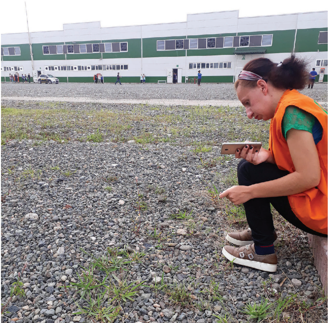
დასაქმებულებს ტელეფონის გამოყენება მხოლოდ შესვენებაზე შეუძლიათ.

წამახალისა კიდეც, ბრიგადას შეურთდები და მეტს გამოიმუშავებო. კი უფრო სწრაფად მოგიწევს, მაგრამ გიღირსო. ისიც, სხვებივით „ნარჩენებში“ იყო და ოცნებობდა, როდის შეურთდებოდა ახალ ბრიგადას.