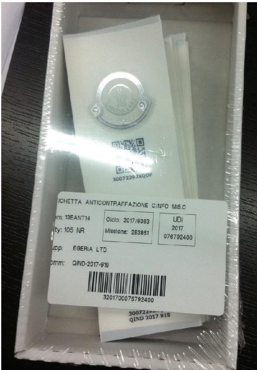
ორიგინალური Moncler ქურთუკები მხოლოდ ამ ჩიპებით გამოირჩევა.