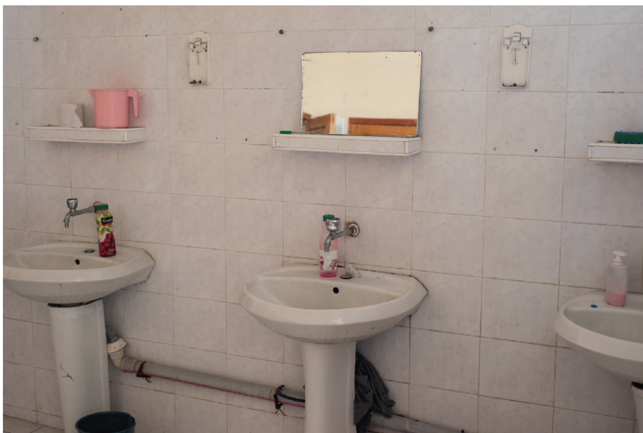
ქარხანაში ჰიგიენური საშუალებები მინიმალურია.