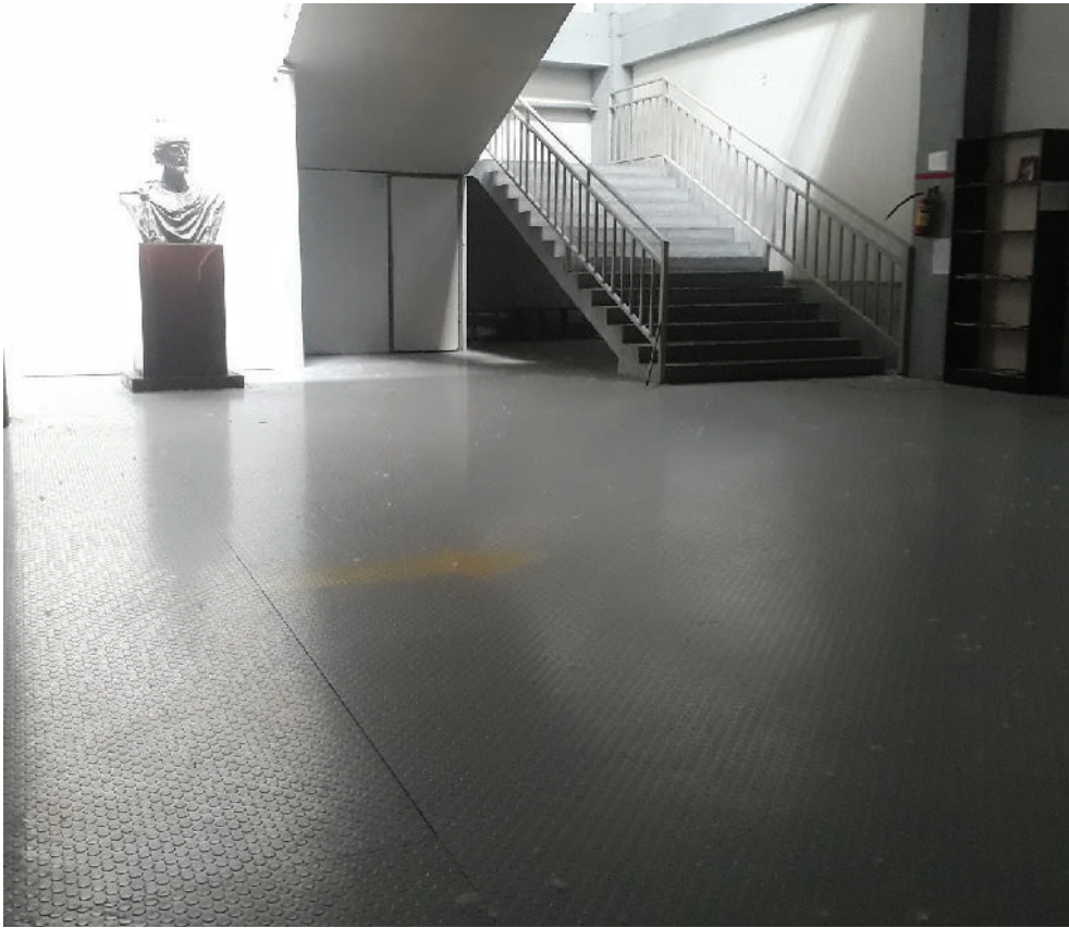
თეთრი ნაწილაკები ბუმბულია, რომლითაც ქურთუკებს ავსებენ.

მთელი დღის განმავლობაში ადამიანური რესურსების მენეჯერი მხოლოდ ერთხელ დამელაპარაკა, ოღონდ ეს „საუბარი“ რამდენიმე წამს გაგრძელდა. გვერდით ჩამიარა და, სანამ რალაცის კითხვას მოვასწრებდი, მომადახა, თითებს მოუფრთხილდით.