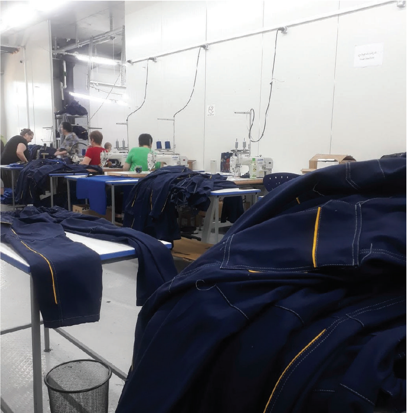
ბევრს ალერგია უვითარდება.

სახელოსნოში ასე ოცდაათამდე ვიქნებოდით. მანქანების ხმაურს ზოგჯერ თუ გადაფარავდა მთავარი ოსტატებისა და მკერავების კამათი და ყვირილი.