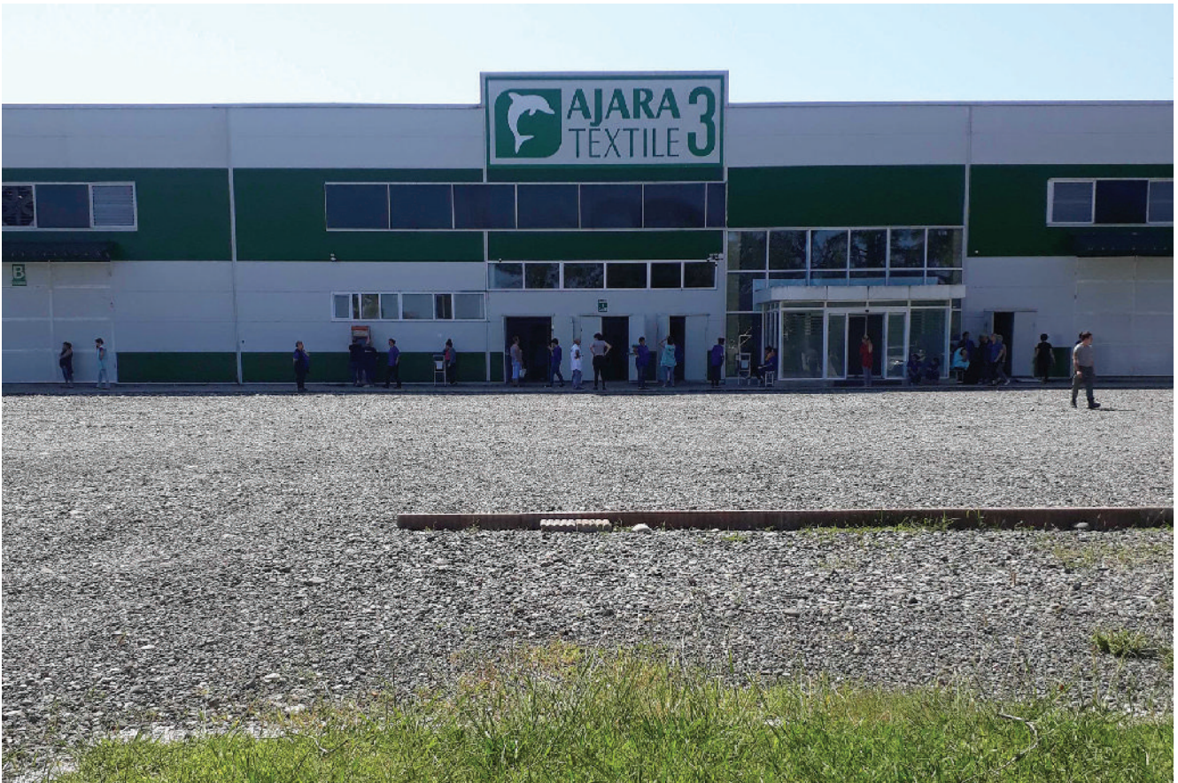
„აჯარა ტექსტილში“ შემოსვლისას დასაქმებულებმა უსაფრთხოების რამდენიმე პუნქტი უნდა გაიარონ.

საჯარო სამსახურის დატოვების შემდეგ ალექსანდრე თოფურია ფოთში მდებარე სხვა, თურქულ თანამფლობელობაში მყოფი ტექსტილის, გენერალურ დირექტორად დაინიშნა.