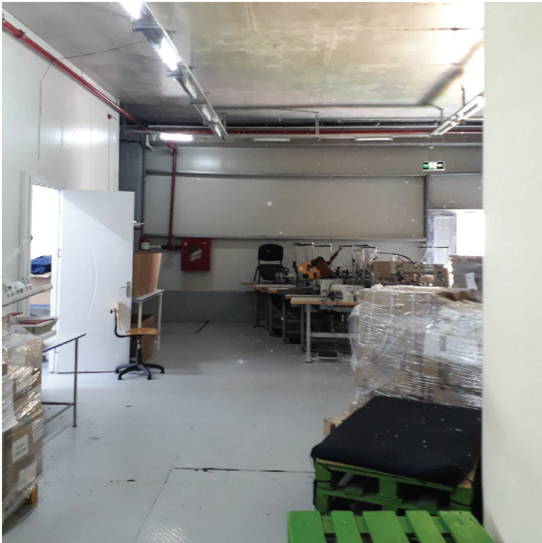
ეს ბუმბული მტვერთან და ძაფებთან ერთად ჰაერში დაფარფატებს.

ჩემი სახელოსნოს უფროსს ვკითხე, პირველი დღისთვის ხელფასს თუ ვიღებდი და მიპასუხა, რომ ეს ბულალტრის გადასაწყვეტი იყო. მოგვიანებით გავიგე, რომ „მოსწავლის კატეგორიის“ ხელფასს ავიღებდი და, „რა თქმა უნდა, სხვებზე დაბალი იქნებოდა“, მაგრამ არავინ არ დამიკონკრეტა, რამდენს.