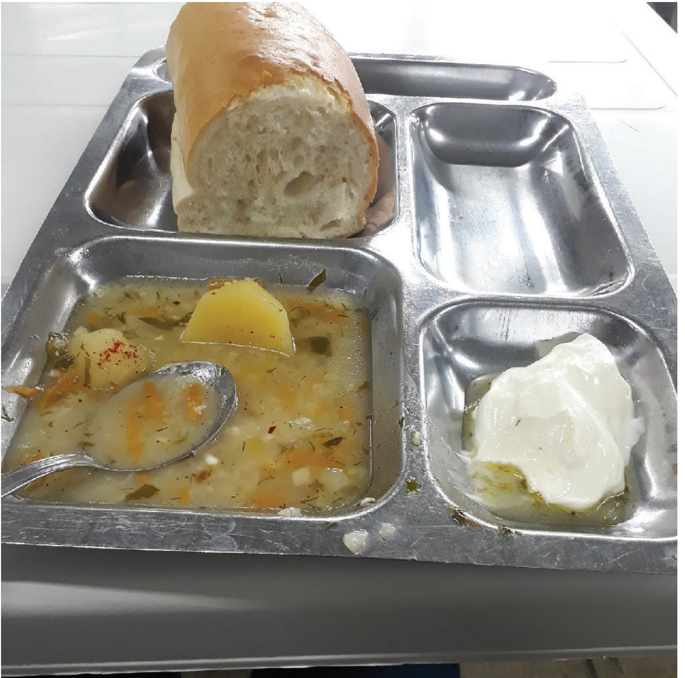
„აჭარა ტექსტილში“ სადილი უფასოა, თუმცა არც ისე ნოყიერი.

დიდი შესვენების დროს სასადილოში გავრბოდი, სადაც ცოტა წვნიანს, ცოტა სალათსა და ნახევარ პურს მეტალის თეფშებზე გვინაწილებდნენ. სადილის შემდეგ დასაქმებულები მცირე ხნით ისვენებდნენ ქარხნის ტერიტორიაზე, სადაც კომპანიას პარკი და პატარა ტბაც კი აქვს მოწყობილი.