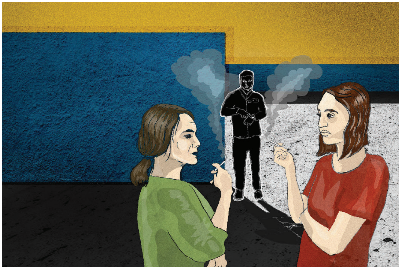
„დაცვის გამოჩენამდეც კი ვგრძნობდით, როგორ გვადგანან თავზე“. ილუსტრაცია: დათო ფარულავა.

ფაბრიკიდან გასვლა მხოლოდ 40 წუთიანი შესვენების დროსაა შესაძლებელი. მოკლე შესვენებებზე ვერ გავდიოდით და მხოლოდ შიდა ეზოში, მოსანევ კუთხეში, გასვლა შეგვეძლო.