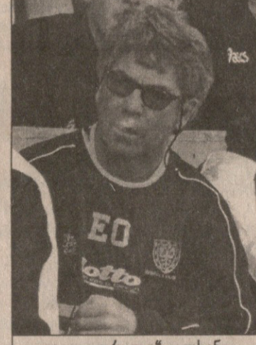
გილ „დრილუ“ ოლსენი

გამიჩნდა და, თითქოს, გაახსენდა ხალხს, რომ 35 მილიონ დოლარად ნაყიდი ფეხბურთელია.