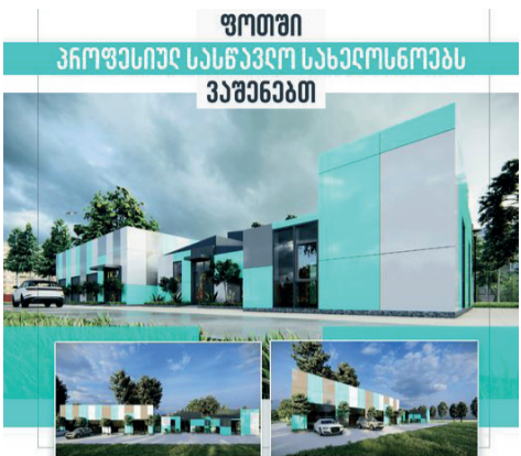
ავტომობილის ძრავისა და სავალი ნაწილის შეკეთების და შედუღების შესასწავლად საჭირო სახე-

ლოსნოების მშენებლობის დასრულება მიმდინარე წლის ბოლომდე იგეგმება. სახელოსნოების აშენების მიზანი სტუდენტებისთვის პრაქტიკის გავლის შესაძლებლობის მიცემაა - სასწავლო პროგრამისა და პროფესიის წარმატებით დაუფლებისთვის. საქართველოში პროფესიული განათლების მიღება ყველა დაინტერესებული პირისთვის ხელმისაწვდომია. სახელმწიფო სრულად აფინანსებს სახელმწიფო სწავლებლებში სწავლას, ასევე ნაწილობრივ კერძო კოლეჯებში სწავლას პრიორიტეტულ მიმართულებებზე. პროფესიული პროგრამების კურსდამთავრებულთა დასაქმების მაჩვენებელი მაღალია და მზარდი.