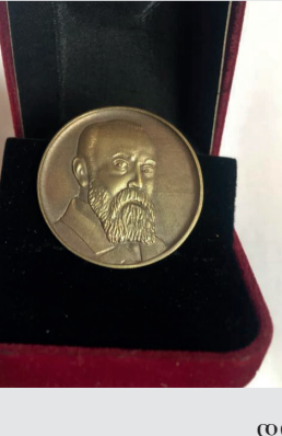
გაბრკელება გე-4 გვ.ჯე

მილოსჟა ნაჟო თოდანს ფოთის დამსახურებულ მშენებელს, ფოთის საპატიო მოქალაქეს ვულოცავთ ნიკო ნიკოლაჟის მედლით დაჯილდოებას, რომელ- დიც მას ნაყოფიერი შრომითი და საზოგა- დოებრივი საქმიანობი- სათვის გადასცა ნიკო ნიკოლაჟის საზოგა- დოებამ.