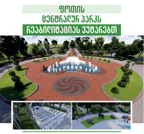
ალტური ღონისძიებების ჩატარების მთავარი ადგილი იქნება.

პროექტის ფარგლებში ეწყობა საფეხმავლო ბილიკები, შენდება სასვენებელი ნაგებობა, დაგეგმილია დასასვენებელი ბაქნების და სათამაშო (საბავშვო) მოედნების, გაზონის, საპარკო სკამების, სასმელი წყლის შადრევნების, დეკორატიული განათების ბოძების მოწყობა და ა.შ. ფოთის ცენტრალური პარკში მრავალწლიანი, უნიკალური ჯიშების საზღვარგარეთიდან ჩამოტანასა და პარკის განაშენიანებაზე ზრუნავდა ფოთის ქალაქის თავი ნიკო ნიკოლაძე. აღდგენითი სამუშაოების შემდეგ ფოთის ცენტრალური პარკი ფოთელთათვის თავშეყრის, კულტურული და სოციალური ღონისძიებების ჩატარების მთავარი ადგილი იქნება.