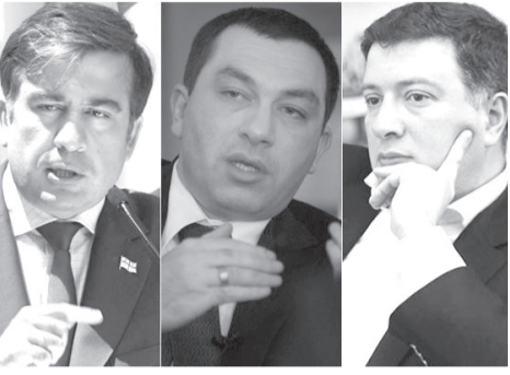
ამათი იმედი აქვს ქვეყანას?

ჩვენს 30 წელი სუცემოებაზე ვიხილოთ ემოხიასიის ბუნა