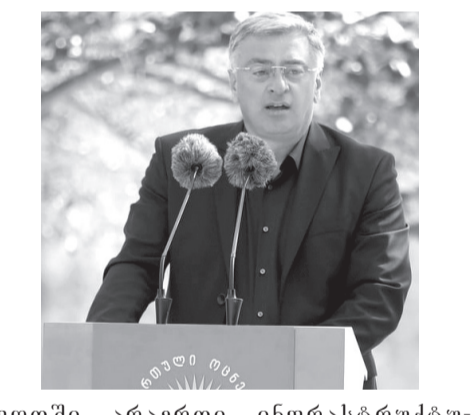
ფოთში არაერთი ინფრასტრუქტურული და სოციალური პროექტი განხორციელდა. გაბრკელება გე-3 გვ.ჯე

ეს უდიდესი პასუხისმგებლობა და პატიჟია. მაქსიმალურად ვიქნები ინიციატო- რი და განხორციელების პროცეს- ში აქტიურად ჩართული ყველა იმ პროექტსა და პროგრამაში, რაც ფო- თის, სოზის და სენაკის მაცხოვრე- ბლების კეთილდღეობისკენ იქნება მიმართული. დარწმუნებული ვარ, ჩვენი ერთობლივი მუშაობით 4 წლის შემდეგ უფრო ღამაჟ და გან- ვითარებულ მუნიციპალიტეტებს მი- ვიდებთ. ძალ-ღონეს არ დავიშურებ და აქტიურ ლობირებას გავუწევ ყველა იმ პროექტს, რაც ფოთელე- ბის, სოზელეობისა და სენაკელეობის წინსვლასა და ღარმატებას უზრუნ- ველყოფს. ჩვენი ხელისუფლების პირობებში