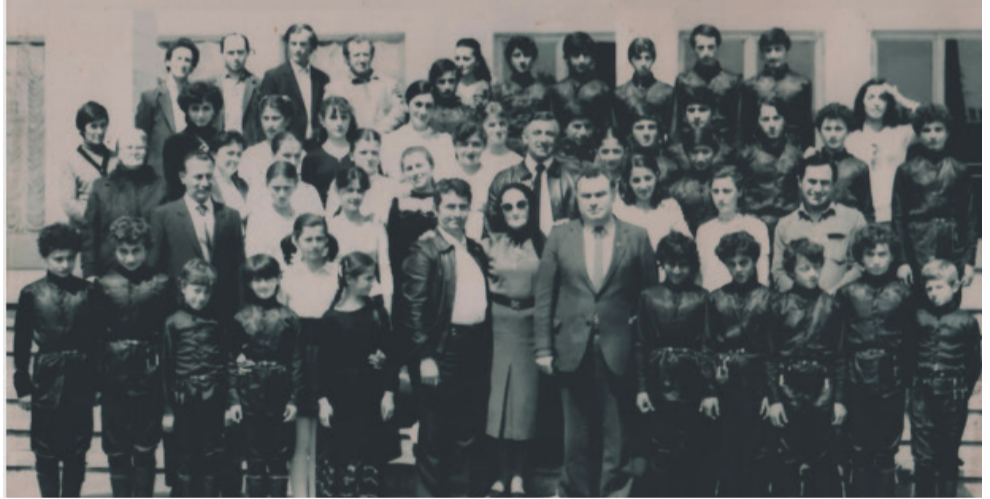
პირველი „სომეცობა“ სოფელი - 1977 წელი

ქვეყნის წარსული ის ბალავარია, რომელსაც ეყრდნობა მომავლის ნაგებობა. ერის იტორია ის დედაბოძია, რომელიც სახელმწიფოებრიობას ამბარებს. ბევრი რამ არის პატივმისაგები ჩვენი დიდებული წარსულიდან, რამაც უნდა მოგვცეს წინააღმდეგობათა დაძლევის ნიჭი. ერთი ასეთი მოვლენა გახლავთ საეკლესიო დღესასწაული „ცოტნეობა“. ხობის უძველესი მონასტრის ეზოში განისვენებს, შერგილ და ცოტნე დადიანების ოჯახის წევრები. აქვე იყო მათი ფრესკა, რომელიც მავანმა წაშალა. წმინდანის სახელზე წირვა-ლოცვა აღევლინება 12 აგვისტოს. აქ მოდიან ხობელები, სტუმრები სხვადასხვა რაიონებიდან და იმართება საერო-საეკლესიო დღესასწაული, თეატრალიზებული წარმოდგენებით, კონცერტებით, გამოფენებით. პირველი „ცოტნეობა“ განსაკუთრებითაა აღბეჭდილი ხობელთა