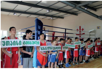
ტურნირი დაიწყო, რომელშიც 2005-2006 წლებში დაბადებული მოკრივეები იღებენ მონაწილეობას.

ფოტოში ზურაბ სარსანიას სახელობის ტურნირი დაიწყო, რომელშიც 2005-2006 წლებში დაბადებული მოკრივეები იღებენ მონაწილეობას.