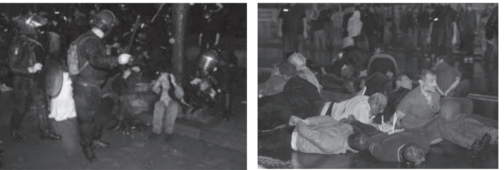
საქართველოს სახელმწიფოებრიობის აღდგენის დღეს-26 მაისს „ნაცბანდის“ მიერ ნაცემი ქართველების ქვითინი დღესაც აღვიძებს თბილისს.

გიგინა ივანიშვილი პარტია „ქართული ოცნების“ თავმჯდომარე: „ვიღებ პასუხისმგებლობას ერთ წელიწადში გამოვასწორო მართვის ყველა ხარვეზი.“ მინდა მივმართო „ქართული ოცნების ძველ გვარდიას, მათ ვინც შეუძლებელი შეძლეს 2012 წლის იმ ისტორიულ დღეებში, საქართველოს კიდევ ერთხელ დაჭირდა თქვენი ერთგულება და გამოცდილება, თქვენი სამოქალაქო გმირობა. მე ვიცი თქვენი გულისტკივილი, მე ვიცი თქვენი გაბრაზების ყველა მიზეზი, გაძლევთ პირობას, რომ ყველა პატრიოტი იპოვის საკუთარ ადვილს თავისი დამსახურების მიხედვით, ჩვენს ერთიან ოჯახში, არავის ღვაწლი არ დარჩება უყურადღებოდ!