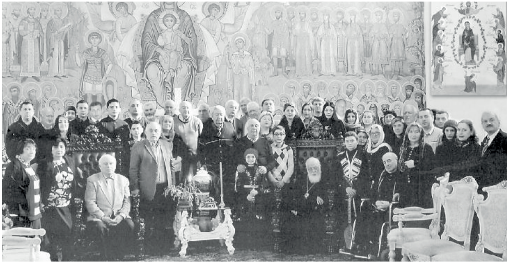
„ფაზისის“ აკადემიამ ილია II დიდი იუზილუ მიულოცა