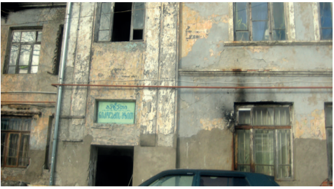
საპარტიოებში, სამწესობარო, ცოტაა სახელმწიფოებრივად მოაზროვნე პრესა-ტელევიზია. ბევრი ასრულებს კლანების დაკვეთას და ქვეყანას წარსულისკენ ექაჩება. მათი უმეტესობა ფინანსდება სხვადასხვა საეჭვო წყაროებიდან-როგორც ქვეყნის შიგნით, ისე-ქვეყნის ფარგლებს გარეგან და ასეთ დროს სერიოზული პრესა მივიწყებულა, მაშინ, როცა სახელმწიფო ბიუჯეტიდან ფინანსდება პარტიები, დან საკმაოდ სოლიდური თანხით- 50 მილიონით. რატომ არ შეიძლება ადგილებზე, რევიზორებში იყოს საზოგადოებრივი პრესა-ტელევიზია ხალხის ბიუჯეტიდან დაფინანსებული, თუნდაც ყველა ერთად მინიმუმ ერთი მილიონით, რომელიც ანგარიშგადგობის იქნება ამავე ხალხის წინაშე და ხელს შეუწყობს დემოკრატიის განვითარებას, ადამიანების ერთი მიზნისკენ გაერთიანებას და არა დაცვა-ტელევიზიასა და უაზრო კინკლაობას. აღსანიშნავია, რომ რევიზორებში თითქმის ყველა პრესა-ტელევიზიან უხმარებია სხვადასხვა ფორმით. რაც შეეხება ქალაქში არსებულ ვითარებას, იგი, სამწესობარო, გამონაკლისია. „ნაციონალისტების“ ხელისუფლებაში მოსვლამდე მერია-საკრებულოს მქონდა საკუთარი ორგანო გაზეთ „ფოთის უწყებანი“-ს სახით, რომელიც წინა ხელისუფლებასთან, უფრო სწორად რევიზორთან დაპირისპირებას შეეწირა.

შემდეგ მის ბაზაზე ჩამოყალიბდა გაზეთი „ნიკოლაის გზით“, რომელიც ასევე ებრძოდა. „ნაციონალისტების“ რეჟიმს და გარკვეული წელიწადი მიუძღვის „ოცნების“ გამარჯვებაში. დღეს მას უჭირს ფინანსურად, რადგან მწირია გასაღების ბაზარი, ხოლო ხელმძღვანელი ორგანიზაციები, დაწესებულებები შემცირდა, უმეტესობა გაუქმდა (ქარხნები, ფაბრიკები, ფირმები და ა. შ.). აღსანიშნავია, რომ გაზეთი არის მატრიანე, ხიდი ხალხსა და ხელისუფლებას შორის, კომუნიკაციის საშუალებად და მას ვერ შეეცვლის ინტერნეტ-გაზეთი.