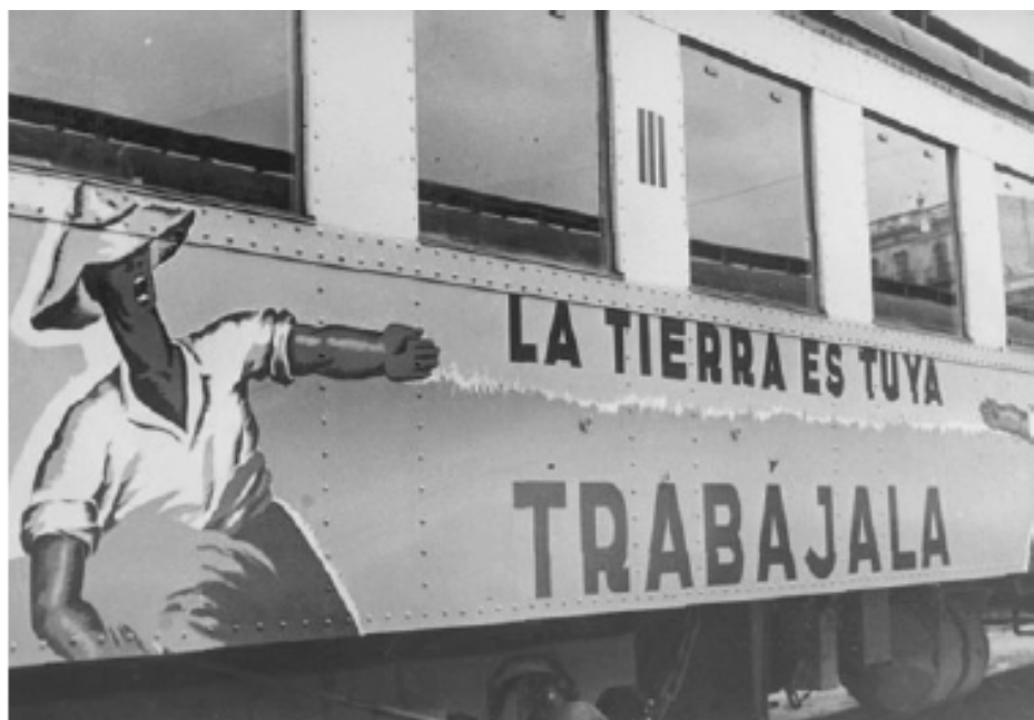
“მიწა შენია, დაამუშავე!”, ლოზუნგი მატარებელზე, კატალონია, 1936 წელი.

ქისტებს საშუალება მიეცათ შავი დროშები ახალი კაპიტალიზმის წინააღმდეგ გაეშალათ, რომლის მესაჭეებად ისევ ძველი მჩაგვრელები იქცნენ. ანარქისტები საკუთარი თავის ერთგულები არიან, მათი პრორიტეტები უცვლელია.