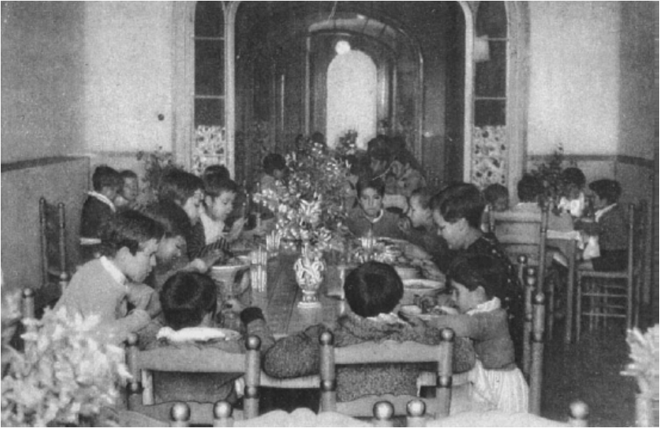
სადილობის დრო ფრანცისკო ფერერის სკოლაში, კატალონია. 1936 წლის რევოლუციის შემდეგ, ფერერის სკოლაში, 60 000-მდე ბავშვი სწავლობდა.