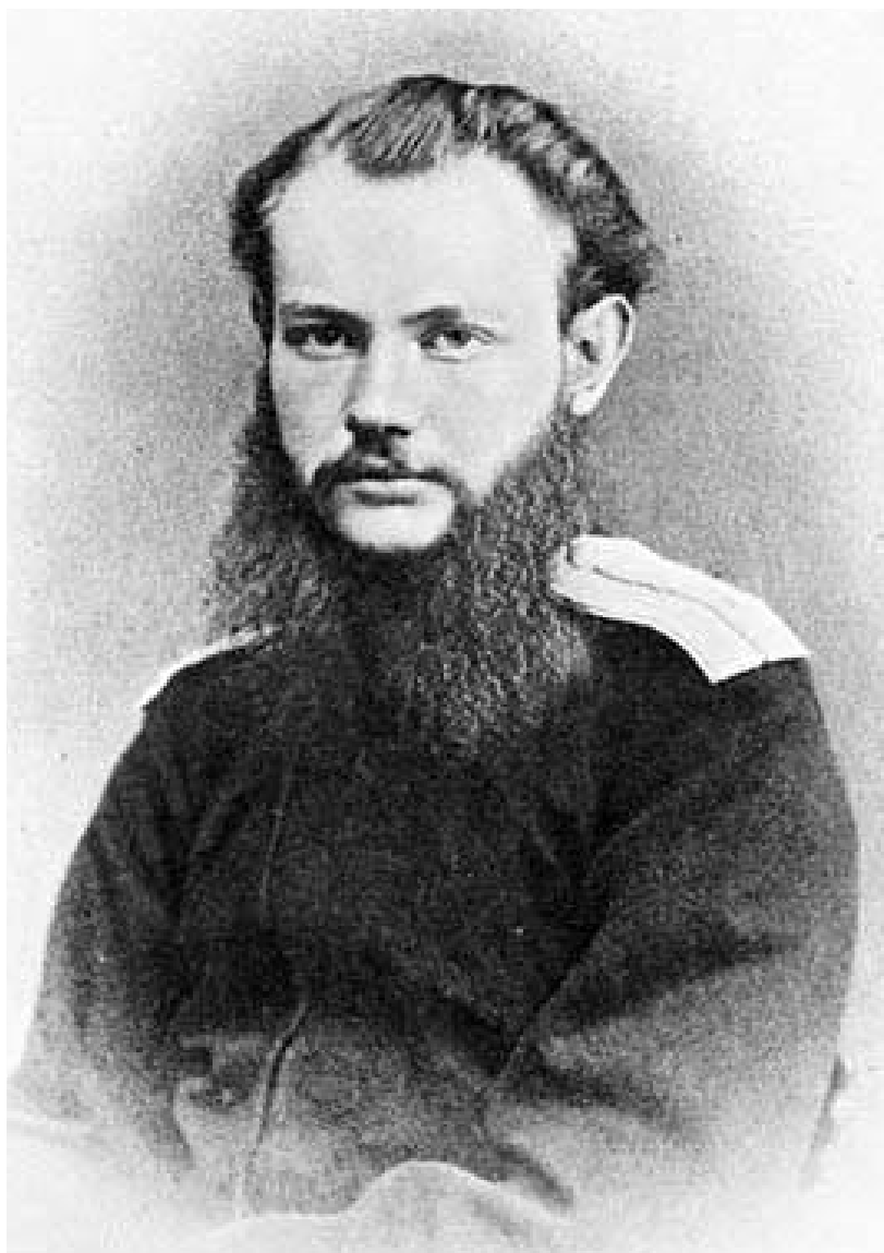
პეტრე კროპოტკინი (1842-1921). ფოტო გადაღებულია 1864 წელს, როდესაც ის ციმბირის პირველ ექსპედიციაში გაემგზავრა, რუკაზე დაუტანელი რეგიონების საკვლევად