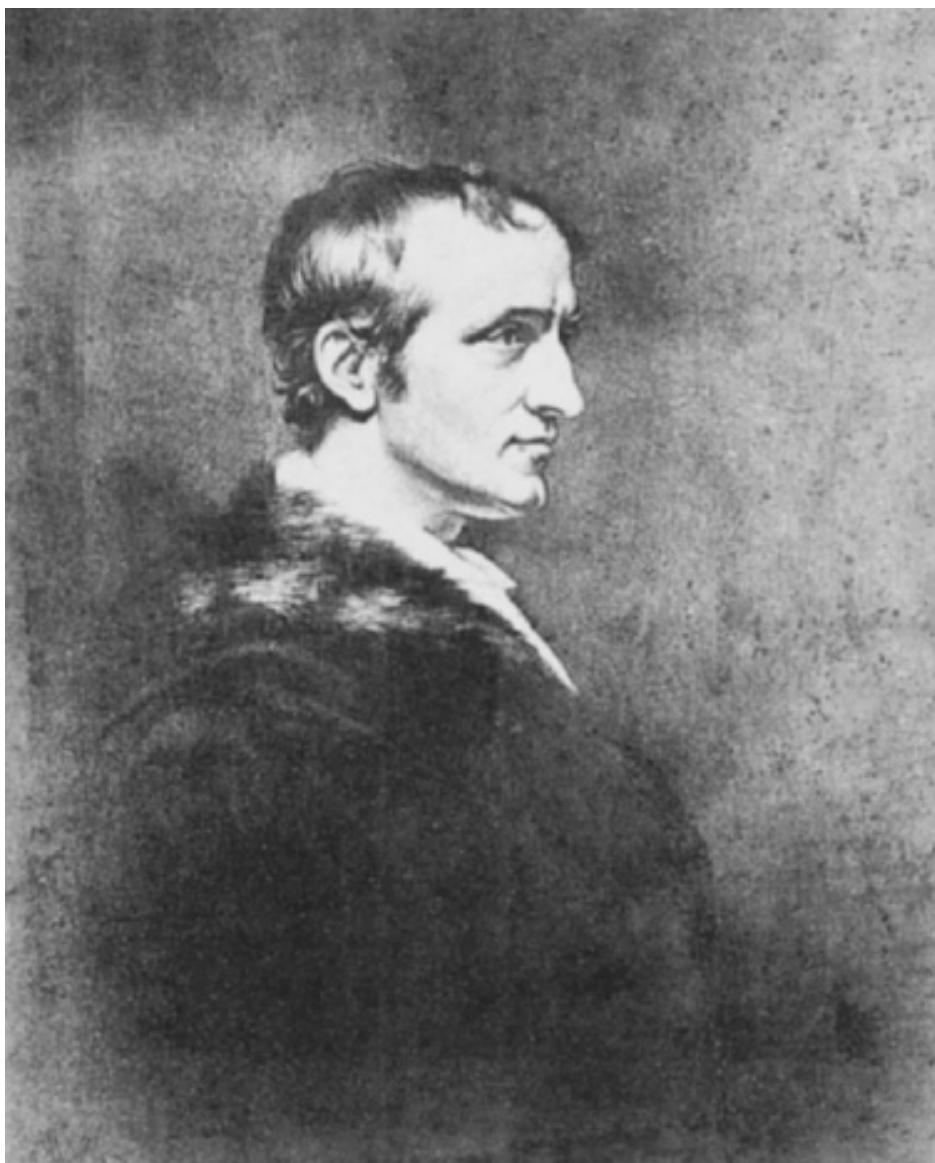
ჯეიმს ნორტკოტი. "უილიამ გოდვინი" (1736-1836), ზეთი, ტილო; 1802 ეროვული გალერეა, ლონდონი