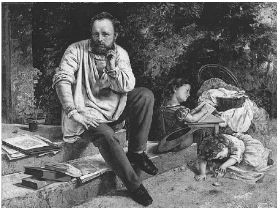
გუსტავ კურბე. "პრუდონი შვილებთან ერთად", ზეთი, ტილო; 1865