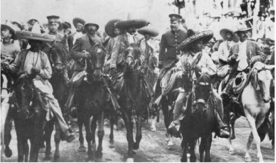
მექსიკაში დაბრუნებული ემილიანო ზაპატა და პანჩო ვილა, მას შემდეგ, რაც გააძევეს გენერალი უერტა, 1914 წელს. თავად ზაპატას ჩაუსაფრდნენ და მოკლეს, 1919 წელს