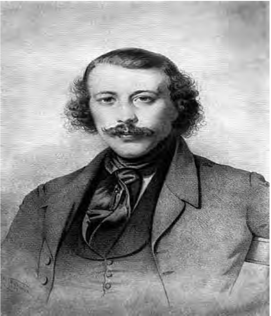
ჰენრი მითროიტერი. "ახალგაზრდა მიხეილ ბაკუნინი"