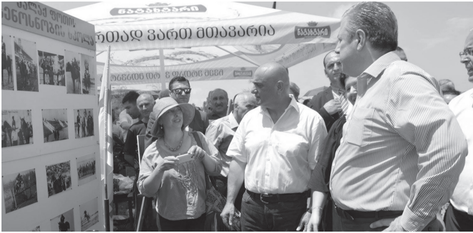
საქართველოს ჰეატი-მინისტრი ბიძინა ჰაჩიკაშვილი და მხარის ბაჰაიური მიილუს წევრები ფოტოსახილველში

25 ივნისს სენაკის იპოდრომზე გრანდიოზული საცხენოსნო შეჯიბრი „მარულა 2016“ ჩატარდა, რომელშიც მონაწილეობა მიიღო საცხენოსნო კლუბებმა საქართველოს სხვადასხვა რაიონებიდან, მათ შორის ფოდი-