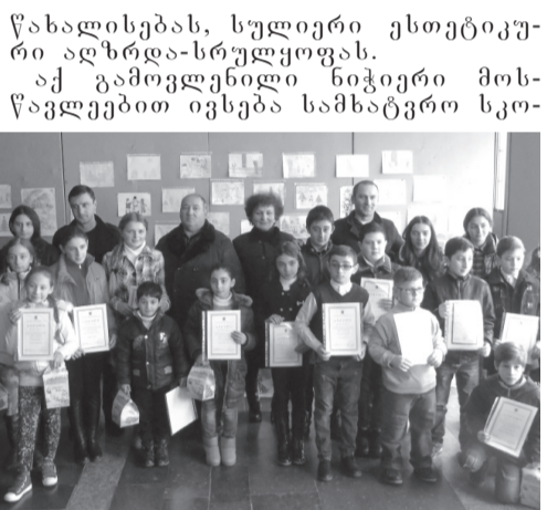
ღიბსა და სამხატვრო სასწავლებლებს კონტიგენტი.