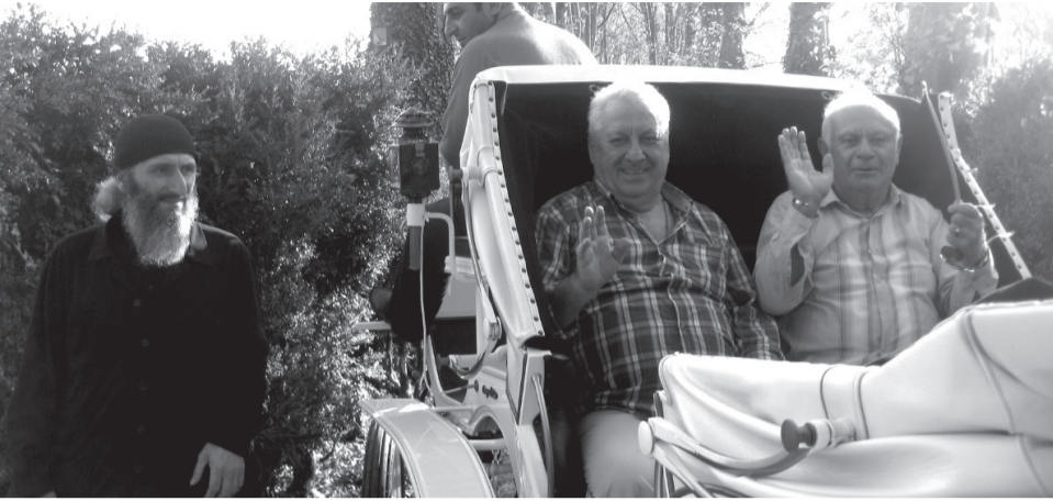
სალხინო, დადიანების ეტლით მიაცილებენ იუბილარებს