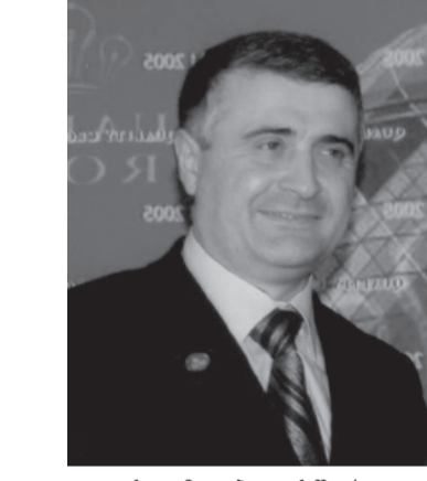
კაცის გზა ბედისწერაა თითქოს, რაღაც გარდაუვალი, როცა იქნა ისევე-ან ცხოვრებას დრმად ჩასწვდები მიხვდე-

იშვიათია კაცი სამართალდამცავ ორბანოებში ხელმძღვანელ თანამდებობაზე, მათ შორის პროფკავშირში და ემუშაოს და ასე უყვარდეს ხალხს, ალბათ, მიზეზი სამართლიანობა, კაცობა და სიყვარული იყო.