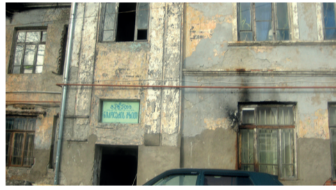
საგანმანათლებლო ცენტრი ღვთისმშობლის შობის სახელობის ქ. რაჭის ქ. 40 ნაღი ამსახურა ქალაქის დასახლებაში. „მე ვანი მთავარი, ვანი მთავარი, ვანი მთავარი, რამდენს ვანი“

დაწერა სააკაშვილზე - „გიჟი“ მოდი-სო, ამ „გიჟმა“ მილიარდები წაართვა ქვეყანას, ეს „ჭკვიანი“ რედაქცია კი ლამისაა დაინკარგეს.