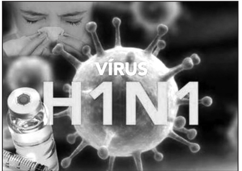
P.S. დაავადების სიმპტომების გამოვლენის შემთხვევაში დაუყოვნებლივ მიმართეთ ექიმს!