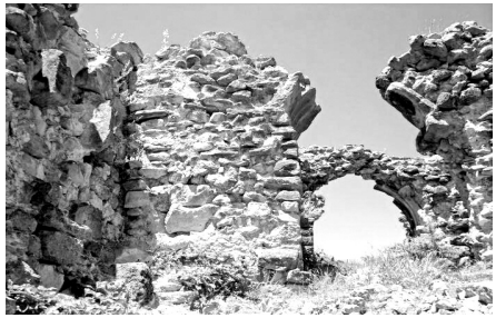
„არს მთის კალთას, სკანდას, სასახლე მეფეთა და ციხე დიდი, დიდშენი“ ვახუშტი ბაბრათიონი