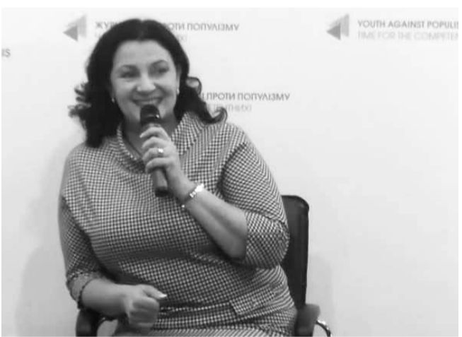
ევროპულ და ევროატლანტიკური ინტეგრაციის საკითხებში უკრაინის ვიცე პრემიერი ივანა კლიმპუშ-ცინცაძე

სტუმარი ჟურნალისტები ადგილობრივ კოლეგებთან ერთად მედია კრიზისულ ცენტრში „შთ მიერ მონაღებულ პრეზენტაციას დავესწარი. „შთ ააშკარავებს დეზინფორმაციებს უკრაინასა და მის ფარგლებს გარეთაც. ჟურნალისტებისთვის ასევე საინტერესო აღმოჩნდა