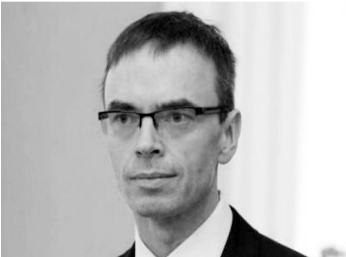
ევროკავშირის თავმჯდომარე, ესტონეთის საგარეო საქმეთა მინისტრი სვენ მიქსერი

სვენ მიქსერი დიდი მძღველად მიიჩნევს ზემოთ ხსენებული ქვეყნების მოქალაქეებისათვის შენგენის ზონის ქვეყნებთან უფიზო მიმოსვლის შესაძლებლობას: „უბრალო მოქალაქეებისთვის ნაკლებად აქტუალური იყო საქართველოს, მოლდოვასა და უკრაინის ევროკავშირთან ასოცირების ხელშეკრულების ძალაში შესვლა. თუმცა, ეს არის ყველაზე პროგრესული ხელშეკრულებები იმათ შორის, რომელიც აქამდე გაფორმებულია ევროკავშირსა და ამ სამ ქვეყანას შორის. მარტივი ფორმულაა - პარტნიორობი საფუძვლად იღებენ ევროკავშირის ნორმატიულ-სამართლებრივ ბაზას და ამით გზას იხსნიან ევროკავშირის ბაზრებისკენ. ხსენებული ხელშეკრულებებით თანამშრომლობა არ ამოწურება, პირიქით, ახალი ვალდებულებები პარტნიორებს შესაძლებლობას აძლევს, ევროკავშირს სამომავლოდ მოთხოვონ დიდი დათმობები“.