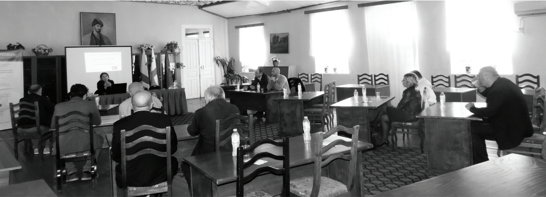
დისკუსია მერობისა და მაჟორიტარობის კანდიდატებთან

ფოთი საზღვაო ქალაქია და აქ აუცილებლად უნდა იყოს საზღვაო სასწავლებელი. ფოთს ქვეყნის კარიბჭეს უწოდებენ, უნიკალური შესაძლებლობები აქვს და უნდა გამოვიყენოთ. უნდა გაიხსნას ორი უნივერსიტეტის ფილიალი, რაც ფოთს გადააქცევს სტუდენტურ ქალაქად. ეს თავისთავად ნიშნავს მეტ შესაძლებლობებს, მეტ მოთხოვნებს, ქმნის მეტ საცხოვრებელს, კაფე-ბარებს, ავტომატურად ნიშნავს მცირე და საშუალო ბიზნესის განვითარებას. ქალაქში უნიკალური არქიტექტურის დიდი შენობა დგას ე.წ. შიდრომექანიზმების სასწავლებლის, რომელიც სავალალო მდგომარეობაშია. თვითმართველობამ უნდა გადასცეს ჯავახიშვილის უნივერსიტეტს აქ ფილიალის გახსნის უფლებას, დაიღოს ხელშეკრულება, დაარსდეს ფილიალი კეთილმოწყობილი ინფრასტრუქტურით და გარანტირებული იქნება განათლების ხარისხი, იგივე ხარისხის მქონე სერთიფიკატით. სხვანაირად არაფერი გამოვა და ჩამოიშლება. ჩვენ ვფიქრობთ განვითარების საკითხებზე. დროა, ახალი ძალის, სიცოცხლის გაჩენის. ჩვენი გამარჯვების შემთხვევაში მინიმუმ ერთ წელიწადში ან ფილიალი ანაც საზღვაო სასწავლებელი აუცილებლად გაიხსნება. ფოთი უნდა გახდეს სტუდენტური ქალაქი. გამარჯვების შემთხვევაში ჩვენ ახას განვახორციელებთ. სხვანაირად ქალაქს პერსექტივა არ აქვს.