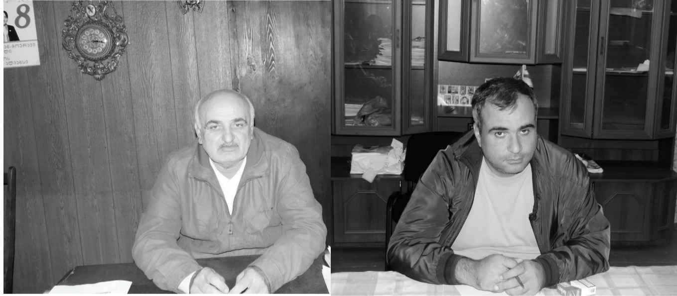
ტურისტებისთვის ფოთი მიიზიდველი ხდება