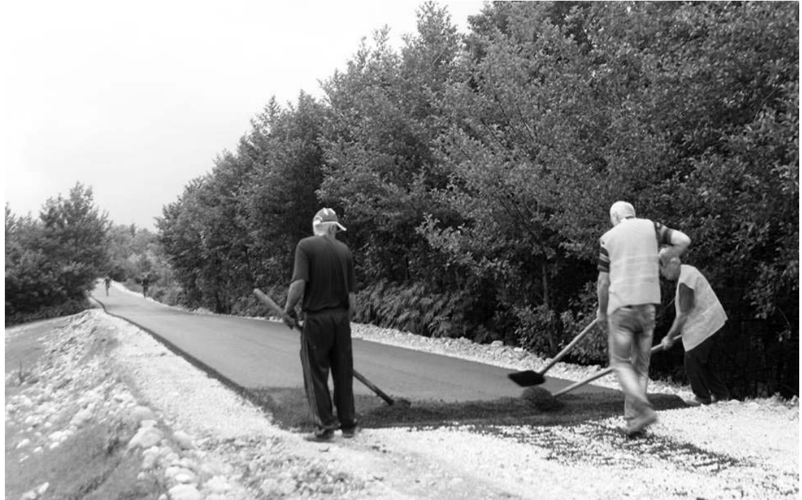
სოფელი ზანა ეწერის უახინ

პროექტს უწოდებს. გადავწყვიტეთ აფაქიძის მიერ ნახსენები საუკუნის პროექტი ადგილზევე გვეჩახა და თავად მოსახლეობას გავსაუბრებოდით. სოფლის ცენტრში შეკრებილბმა როგორც აგვისნეს ეწერის მიმართულებით იმდენად საშინელი გზა იყო, მოსახლეობას სიარული უჭირდა. მას „მოუსავლეთსაც“ კი ეძახდნენ მწარე ხუმრობით. განსაკუთრებით კი იტანჯებოდნენ ბავშვები, რომლებსაც სკოლამდე მისასვლელად 7-8 კილომეტრის ფეხით გავლა ოღრო-ჩოდრო ტალახიან გზაზე უწევდათ. ამჟამად ეს პრობლემა მოგვარებულია. სოფლის მოსახლეობა გაკეთებულით კმაყოფილი აღმოჩნდა. ჩვენს მიერ გამოყოფილთა უმრავლესობამ დადებითად დაახასიათა სოფელში განხორციელებული მნიშვნელოვანი ინფრასტრუქტურული პროექტები. განსაკუთრებით, მადლიერი გახლდათ ეწერის მიმართულებით გზაზე მცხოვრები მოსახლეობა, რომელსაც, ბოლოსდაბოლოს, ედროსა ნორმალური გზა 21-ე საუკუნეში. თუმცა, ზანელს არც შეუსრულებელი დაპირებები და მასთან დაკავშირებული კრიტიკა დავიწყებიათ. მათი თქმით დაპირების მიუხედავად სოფელში არ გაკეთებულა რამდენიმე სტადიონი, შიდა ქუჩები. ასევე არ დაკლავულა საწვავისა და ელექტროენერჯის საფასური. ჩვენ დეპუტატს დაპირებების შეუსრულებლობის მიზეზი ვკითხეთ. მან ეს მცირე ფინანსებითა და დეპუტატო-