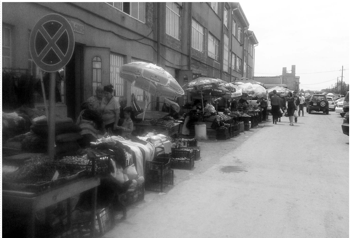
ივაზა პაჩკორია ფოთში

რატომ ბართულდა ბარევაჭრობის აკრძალვა ფოთში