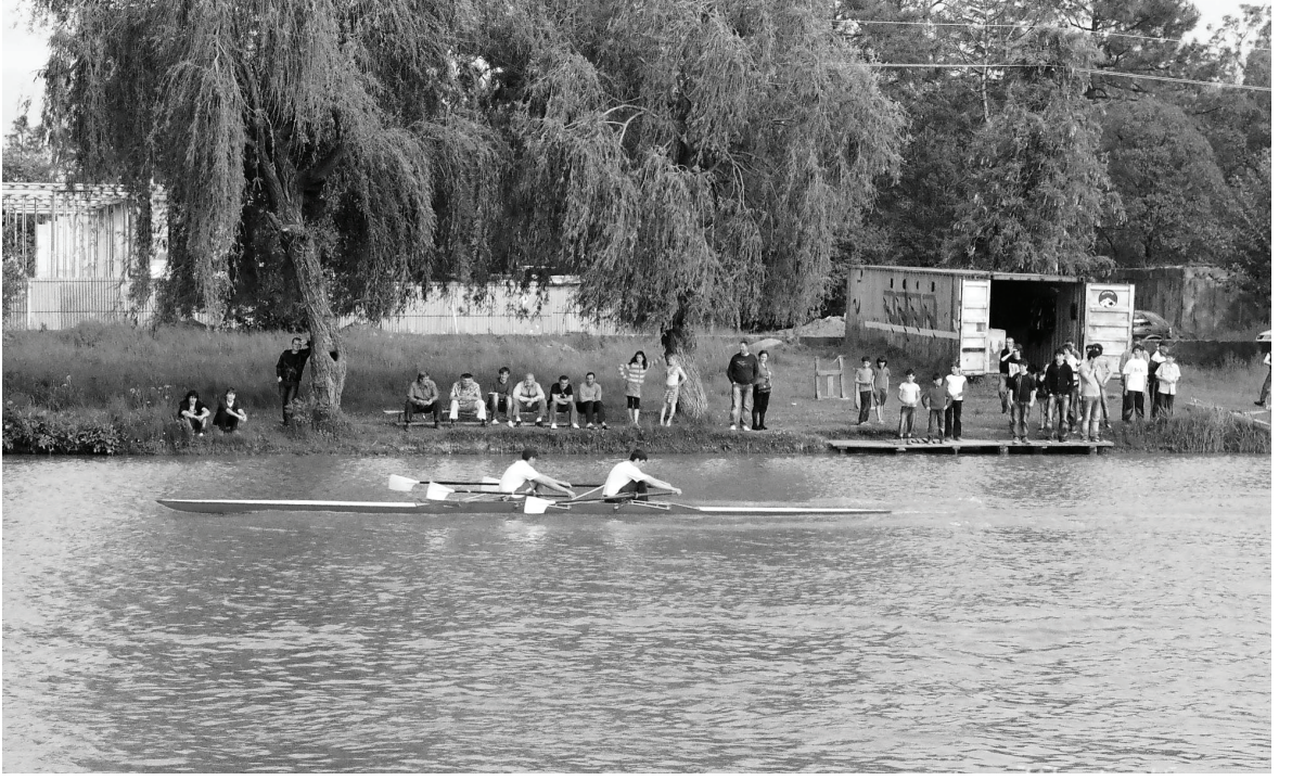
სანიტროსო სკოლის ბაზა ვაჟოვში