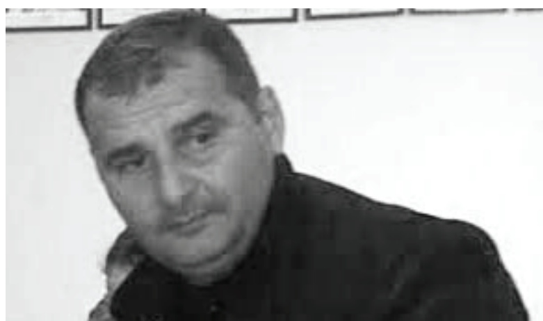
სასპორტო საგანგანოთა და სპორტის მინისტრის მოადგილე ნინო პაჭკორია

პრინციპია შეიქმნას ახალი შემოქმედებითი წრეები, ახალი ინოვაცია შემოვიტანოთ. 8 მარტის ღონისძიებაზე ქუთაისიდან ჩამოყვანილი გვეყავა პანტომიმის თეატრი, თბილისიდან მარიონეტები. ამ ჩამოყვანასაც თავისი დატვირთვა ჰქონდა, რადგან გუგუშაში გვაქვს, ფოთში გაიხსნას პანტომიმის წრე. უკვე ვაწარმოებთ მოლაპარაკებებს შესაბამის ცენტრებთან. ვცდილობთ, შევქმნათ ახალი წრეები, რათა ახალგაზრდობა დაკავდეს ამ საქმიანობით. ძირითადი პასუხისმგებლობა ეკისრება ცენტრის დირექტორს. ხუთივე მენეჯერი გვერდით მიდგას და მოტივირებულიები არიან, რათა საქმე გაკეთდეს. ჩამოყვანილებისთანავე დარეჯან გვეყვითქმენ ჩაატარა დედა-შვილობის ფესტივალი, ჩვენ ვთხოვა დახმარება და დავედქვით გვერდით. 8 მარტს ჩატარდა კონცერტი მუნიციპალიტეტის მერიის თანადგომით. საგამოფენო დარბაზში გაიმართა ადგილობრივი მხატვრების გამოფენა-გაყიდვა. შემოსული თანხა დაურთავდა ხუთ სოციალურად შეჭირვებულ ადამიანს. ასევე, ჩატარდა ახალგაზრდა მხატვრის ნამუშევრების გამოფენა. ამ სამი თვის განმავლობაში