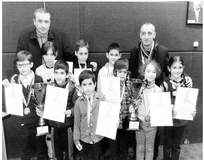
საჯარო სკოლაში ერთი კვირის განმავლობაში მიმდინარეობდა.

აღნიშნული ფესტივალის დაწყებამდე კი ფოთის საჯარო სკოლის პატარა სპორტსმენებმა იასპარეზეს დავით ჩირაძის სახელობის საჯარო ტურნირზე 10, 8 და 7 წლის მოჭადრაკეთა გუნდებს შორის, რომელიც ქუთაისის მაია ნიზურდანიძის სახელობის