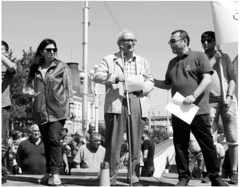
გადაინაცვლებს სააპელაციო ინსტანციაში.

„2011 წლის თებერვლიდან ფუნქციონირება დაიწყო კიდევ ერთმა „კორპორაცია ფოთის პორტის“ ახალმა კერძო საბაჟო-საკონტეინერო ტერმინალმა (Ifo, შპს „ინტენდ კონტეინერ ტერმინალი“), რომელსაც სახელმწიფოს მიერ მიენიჭა ექსკლუზიური ვერბარული უფლება საერთაშორისო საზღვაო საზღვის მიერ ჩამოტანილი მსუბუქი ავტომობილებით დატვირთული კონტეინერების დამუშავებაზე. ამან გამოიწვია აღნიშნული ბიზნესში მონაწილე სუბიექტების არათანაბარ პირობებში ჩაყენება. ამასთან დაკავშირებით, 2014 წლის 3 დეკემბერს, შპს „ჯორჯიან ტრანს ექსპედიცი-ფოთის“ ტერმინალმა მიმართა კონკურენციის სააგენტოს. 2015 წლის 30 მარტს გამოვიდა სააგენტოს გადაწყვეტილება (ბრძანება №40), რომლითაც ერთმნიშვნელოვნად დადასტურდა შემთავლების სამსახურის მხრიდან „კონკურენციის შესახებ“ საქართველოს კანონის მე-10 მუხლის „გ“ და „ე“ ქვეპუნქტების დარღვევის ფაქტები ფინანსთა სამინისტრომ, იმის მაგივრად, რომ სასწრაფოდ გამოესწორებინა ეს უხეში შეცდომა, გამოიყენა თავისი უფლება და გაასახივრა აღნიშნული გადაწყვეტილება თბილისის საქალაქო სასამართლოში, რომელმაც არ დააკმაყოფილა მისი მოთხოვნა და საქმე, სავარაუდოდ,