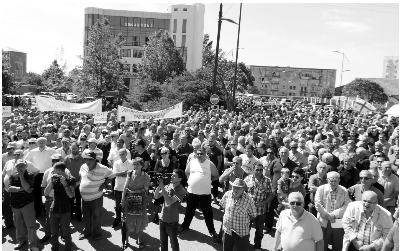
ინყება პაქორია ფოთი

ფოთში 16 გადამზიდავ საკონტეინერო ტერმინალებს უფუნქციოდ დარჩენა, ხოლო 4000-ზე მეტ თანამშრომელს სამუშაო ადგილების დაკარგვა ემუქრებათ. ფოთის პორტის ადმინისტრაციის გადაწყვეტილებით, 1 ივლისიდან ფოთში შემოსული ყველა კონტეინერი შეევა და გაიცემა მხოლოდ „ჩით“-ის სახმელეთო-საკონტეინერო ტერმინალიდან, რომელიც სპეციალურად ამ მომსახურებისათვის შექმნა პორტმა.