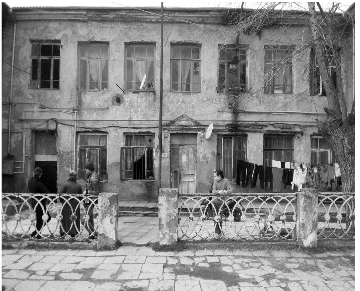
მარი ალიხანაშვილი ფოთი

ფოთის ავტოსადგურის შენობა უმიმებს მდგომარეობაშია 33. 3