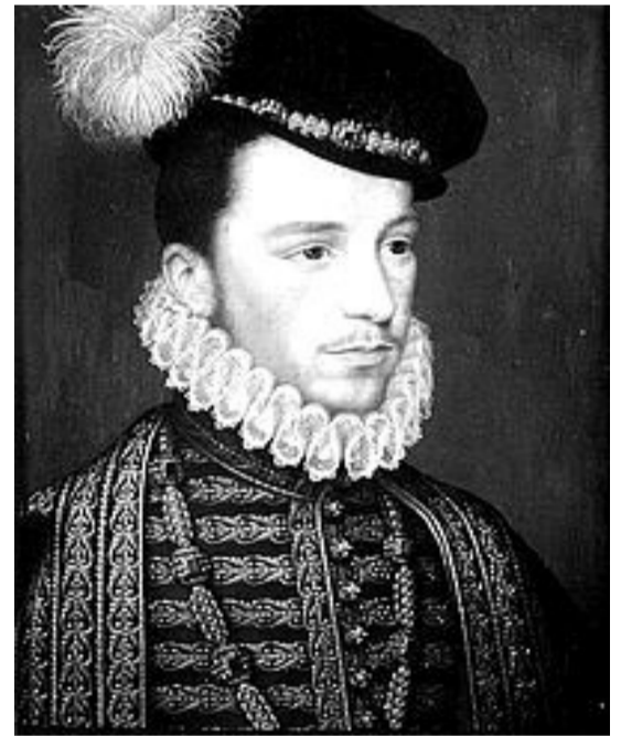
ჰერცოგი დე გიზი

რუსეთში გენერალისიმუსის სამხედრო წოდება შემოღებულ იქნა პეტრე პირველის მიერ, რომელმაც აზოვზე ბრძოლებისთვის, 1696 წლის 28 ივნისს, გენერალისიმუსის წოდება მიანიჭა ვოევოდ ა.ს. შეინს (1662 – 1700 წწ), აღნიშნული წოდება რუსეთში ოფიციალურად გაფორმდა 1716 წელს.