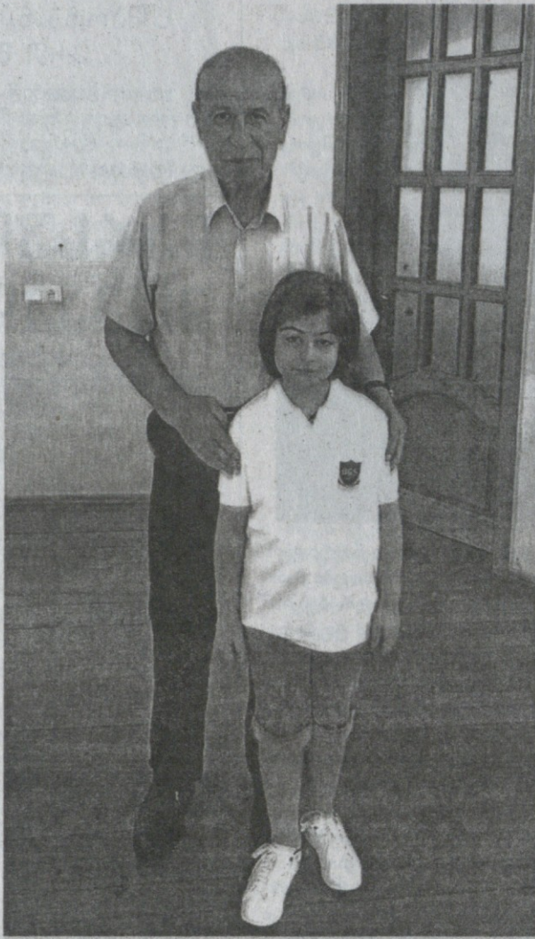
დაცვლილი, საერთო ტკივილმა სულიერად კიდევ მეტად დაგვაახლოვა.