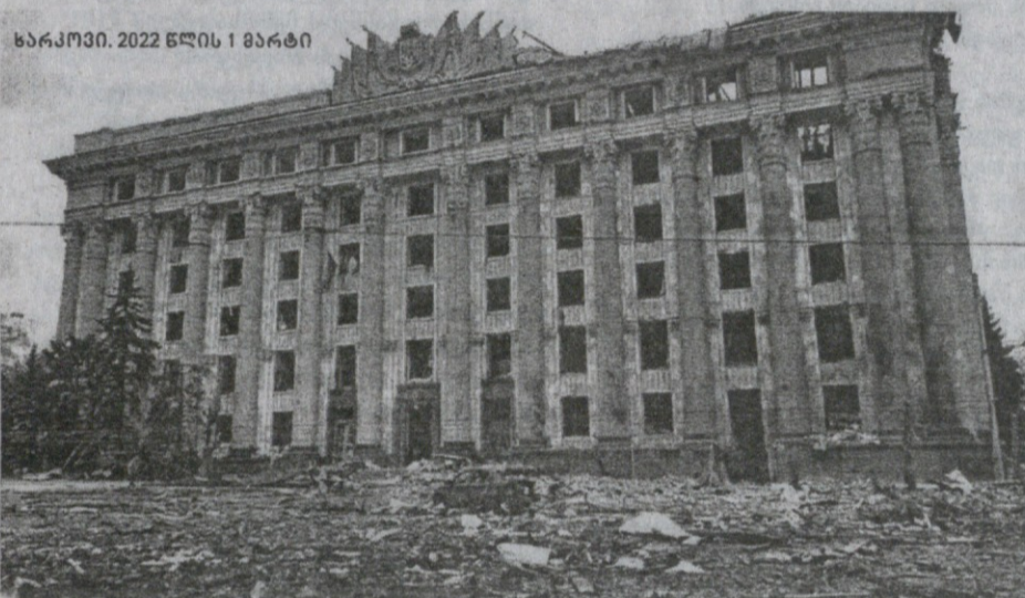
სარკმლი. 2022 წლის 1 მარტი

4 მარტი 2022წ. №2 (4036) ბამოცემის 91-ე წელი ფასი 1 ლარი